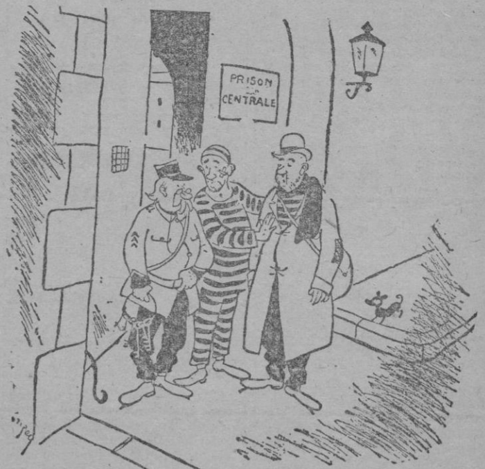
—¿No tiene usted un calabozo bien situado? Es para este amigo, que ha sido puesto en libertad por equivocación.