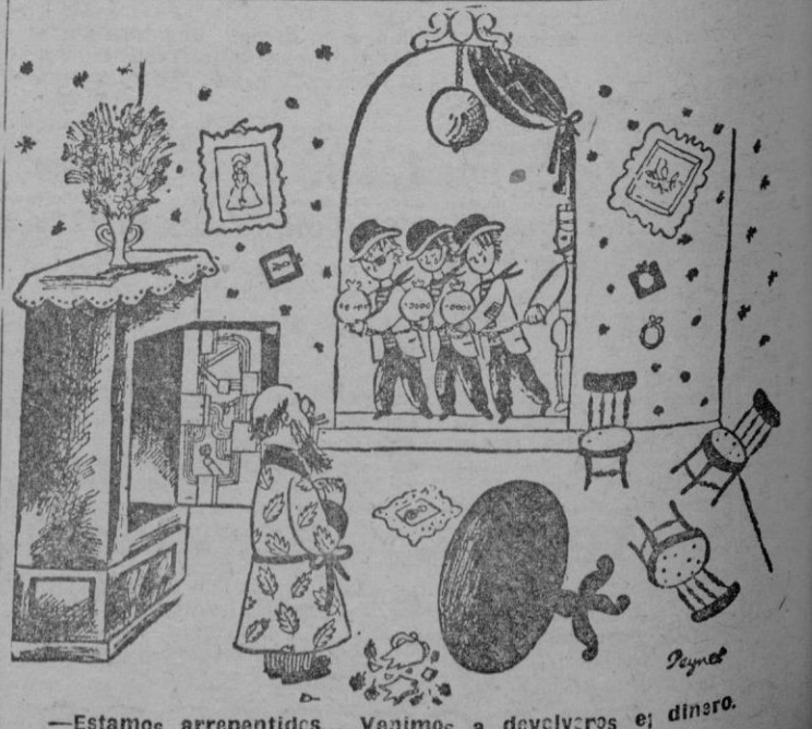
—Estamos arrepentidos... Venimos a devolveros el dinero.