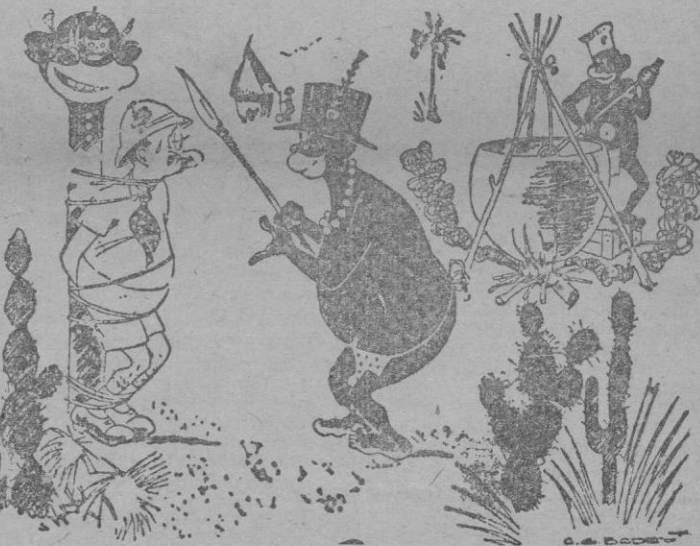
—Tu petición de indulto ha sido rechazada... porque hoy no ha llegado nada del mercado.