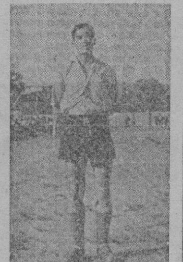
delantero centro del C. D. España de Luchmayor, ayer noche quedó el asunto definitivamente solucionado.

Después de una semana de activas negociaciones llevadas a cabo por el C. D. Mallorca para conseguir la cesión del notable