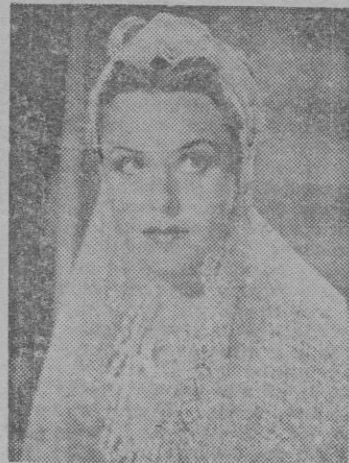
mirable labor en «La pecadora», «La mujer sin nombre» y «Confesión».

Bárbara se decidió a partir, sobrevino la guerra y todo quedó aplazado. La actriz continuó su trabajo en los estudios de Italia, y las pantallas proyectaron su ad-