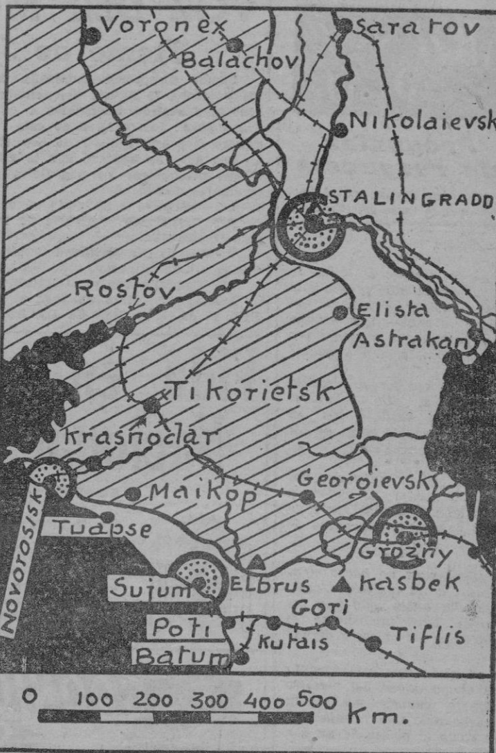
En el frente ruso, en tanto, las operaciones prosiguen en el Cáucaso, según el plan que nuestros lectores conocen. El dominio de los altos collados del macizo montañoso permite a los alemanes mirar francamente hacia el Sur. El pasillo Batum-Tiflis-Bakú está ya en peligro.

Stalingrado presencia luchas terribles. La resistencia bolchevique será encarnizada, pues es mucho lo que representa la pérdida del bajo Volga; mas del resultado final, después de lo ocurrido en Sebastopol y en Rostov, nadie duda. Los contraataques soviéticos, en fin, realizados en otros lugares del frente ruso, no logran los resultados que Stalin se propone. No evitan la continuación de las operaciones en el Cáucaso, ni impedirán tampoco, llegado que sea el momento conveniente, la extensión de la ofensiva más al norte.