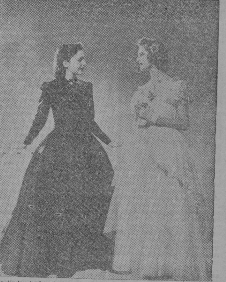
Dos lindos trajes de baile para muchachas. El de la izquierda, de tafetán negro, es de una gran sencillez y elegancia. El de la derecha, más juvenil, es de encaje blanco, en cascada ribeteada con cintas de terciopelo azul celeste