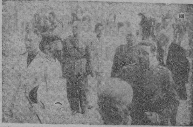
Nuestras primeras autoridades en la presidencia de la solemne procesión que tuvo lugar como final de la fiesta del Beato Ramon Lull