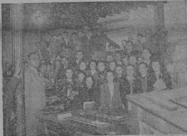
Alumnos del Instituto Nacional «Ramón Llull» durante su visita a nuestros talleres.