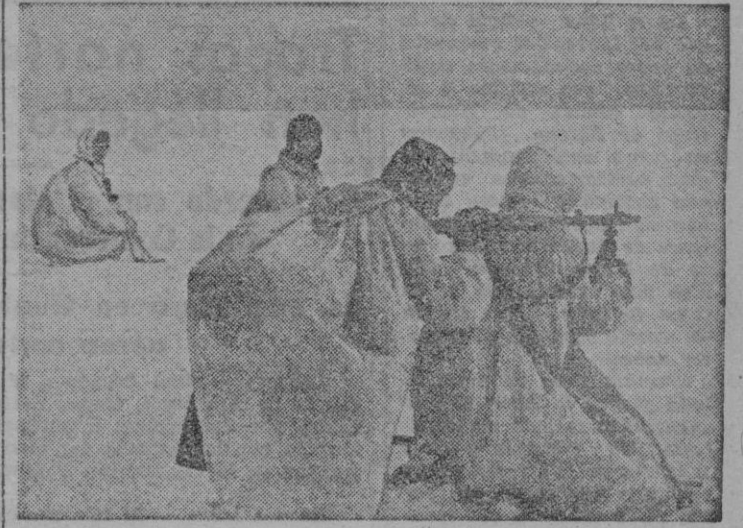
A no ser por el fusil ametrallador que apunta en la dirección del enemigo, el cuadro nos haría imaginar cualquier cosa menos soldados de un ejército en operaciones. — Este es el aspecto que les prestan los capotes de camuflaje