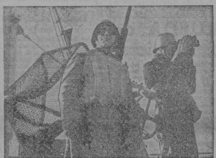
Observadores de un barco alemán de vigilancia siempre alerta para dar la voz de alarma ante un peligro aéreo o marino.