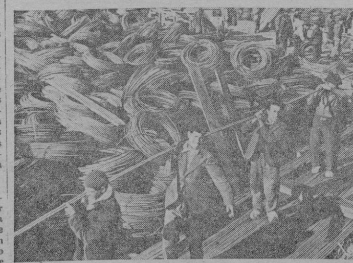
Grandes cantidades de alambre y barras de hierro para las fortificaciones de la costa atlántica construidas bajo la organización del fallecido Dr. Todt