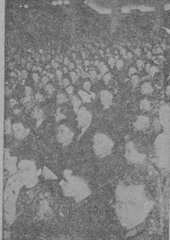
Una de las representaciones del «día de la cultura del pueblo».

La conocida afirmación de que no se puede organizar la cultura, queda desmentida con las realidades culturales alemanas, bajo la inspiración y la alta dirección de la Cámara Cultural del Reich, creada en 1933; la que en la sucesión de los años, ni aun en los actuales de guerra, ha interrumpido su labor, sino todo lo contrario, fomentándola mas y mas, en sus Cámaras especiales, dedicadas a las distintas ramificaciones del mundo cultural y artístico, y en su Senado de la Cultura del Reich, presidido por el Ministro Dr. Goebbels, del que forman parte 80 personalidades destacadas, entre ellas, el maestro Furtwaengler, Gruedgens, Emil Jannings, el arquitecto del Führer, profesor Speer, el ministro Funk, el jefe de las tropas de asalto Himmler, y otros varios.