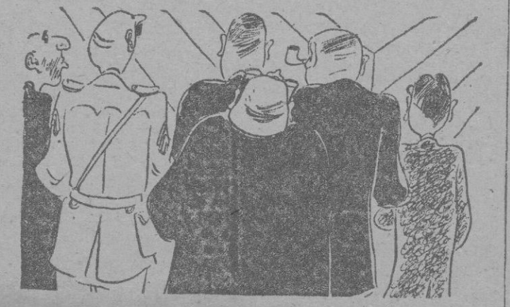
Frente a los objetos diseminados por el suelo se paran los posibles compradores «de viejo».

El rastro palmesano se despierta hasta el sábado de la próxima semana.