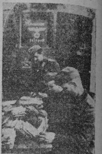
La hora más feliz para el combatiente es aquella en que llega el correo de la Patria lejana.