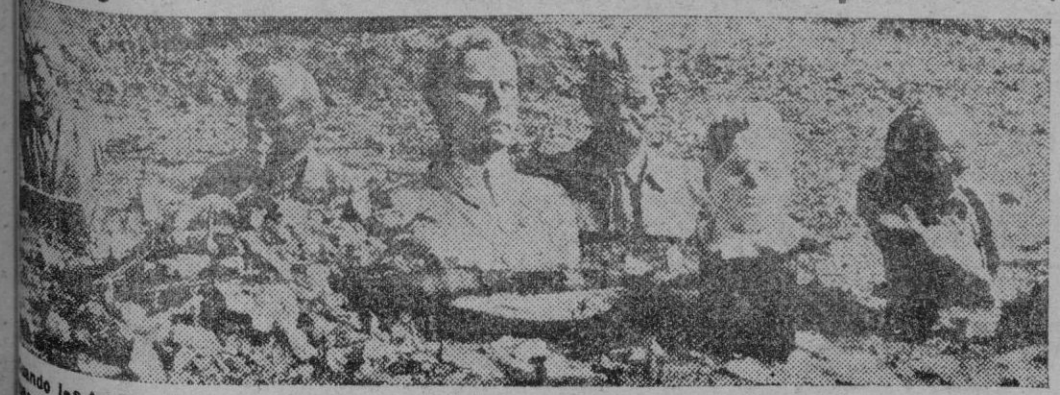
Cuando las tropas alemanas entran en una ciudad, sus habitantes se apresuran a derribar las estatuas de los tiranos que les han oprimido tanto tiempo. Aquí vemos las estatuas destruidas de Lenin, Kálmán, Voroschilov, Kulik y otros.