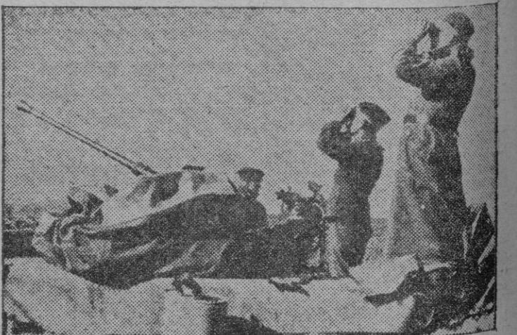
Una pieza antiaérea alemana, preparada para intervenir en el frente ruso