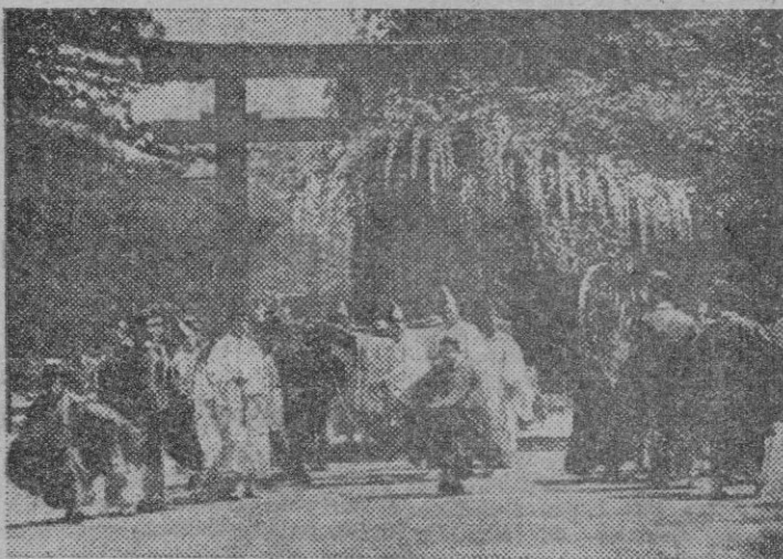
El gran carro imperial durante la fiesta de las glicinas. Adornado de bellísimos ramos de glicinas, este carro, que durante la Edad Media sirvió como carroza de viaje, es arrastrado por sacerdotes. Glicina en japonés es Fugiwara, y éste es el nombre que, en recompensa a los actos heroicos de uno de los antepasados del príncipe Konoye, fué dado al clan de éste

Cuando Jimmu Tenno, el nieto de la Diosa del Sol, conquistó el Japón y fundó la dinastía imperial, iba acompañado por otros dioses menores, que fundaron las cinco Casas Sublimas, entre los cuales deben los emperadores buscar esposa. El dios Konoye —no Mikoto— fué el fundador de la Casa más notable, después de la imperial.