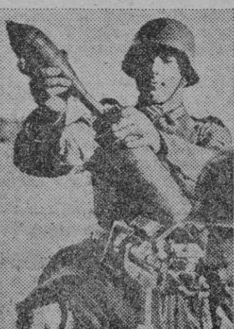
Un soldado de las tropas mecanizadas alemanas, prepara el mortero que lleva en su motocicleta.