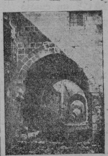
Una calle de Belén, lugar santificado por el nacimiento de Jesús, y en donde dió principio el Drama más admirable que se dió en el Mundo.