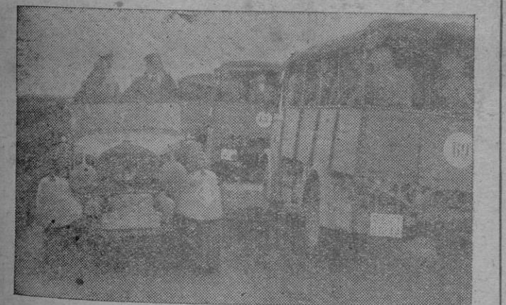
El Duce y el Führer encuentran, en la inspección realizada a diversos sectores del frente del Este, a una columna motorizada del Cuerpo expedicionario italiano en Rusia