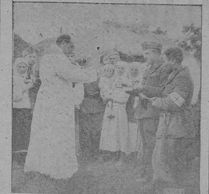
EN UCRAANIA: Un Capellán Castrense del Cuerpo Expedicionario italiano administra el bautismo a los niños nacidos durante el dominio rojo