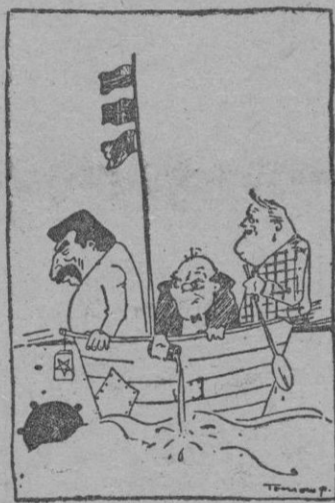
(Del conglomerado Churchill-Roosevelt-Stalin). Tres... eran tres...