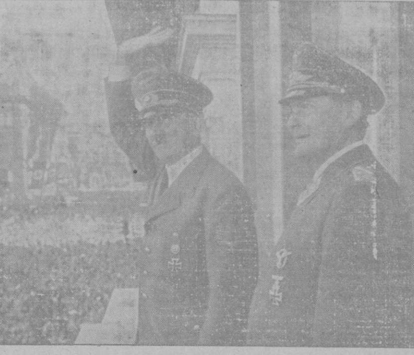
Adolfo Hitler Führer - Canciller del III Reich entregó a sus Mariscales hace unos días, el bastón de mando, simbólico en deberes y responsabilidad. Ante las horas decisivas en que vive el Imperio Británico bajo la amenaza o nstante de las alas y de las proas germanas esta entrega tuvo intenso sabor significativo que fué comentado por toda la prensa mundial. En esta foto que nos llega hoy ofrecemos al lector la silueta de Hitler recibiendo recientemente el homenaje de su pueblo acompañado de Herman Goering.

Ya son muchos los que cuando nos ven nos saludan con el brazo en alto. Pero da la casualidad de que muchos saludan así en presencia de un «wisky», al que consagran, sorbo a sorbo, las mejores horas de un día cuyo rendimiento conocido empieza a la una de la tarde. Como aquí no se engaña a nadie, quede bien claro que nosotros, como todos los humanos que se consagran a un esfuerzo, podremos triunfar o fracasar. Pero que si triunfamos, no triunfaron con nosotros los «señoritos». El ocioso convidado a la vida sin contribuir en nada a las comunes tareas, es un tipo llamado a desaparecer en toda comunidad bien regida. La humanidad tiene sobre sus hombros demasiadas cargas para que unos cuantos se consideren exentos de toda obligación. Claro está que todos no tienen que hacer las mismas faenas, desde el trabajo manual más humilde hasta la magistratura social de ejemplo de refinamiento. Son muchas las tareas que realizar. Pero hay que realizar alguna. El papel de invitado que no paga, lleva camino de extinguirse en el mundo. Y esto es lo que queremos nosotros, que se extinga. Para bien de los humildes, que en número de millones llevan una vida infrahumana, a cuyo mejoramiento tenemos que consagrarnos todos. Y para bien de los mismos «señoritos», que al volver a encontrar digno empleo para sus dotes, recobrarán, rehabilitados, la verdadera jerarquía que malgastaron en demasiadas horas de holganza. («P. E.», 25 Enero de 1934).