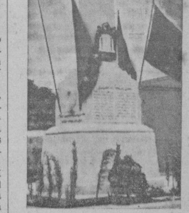
(Información en página 5.)

Roma.—En Francia causa extrañeza el hecho de que Italia no demuestre empeño en entrar en conversaciones para hallar solución a los problemas mediterráneos.