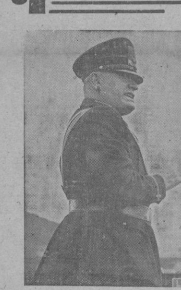
Los periódicos londinenses publican con gran realce tipográfico la nota de Italia, a la que hacen algunos comentarios.

La impresión producida por la enérgica posición italiana es profunda y lo demuestra lo que dicen los periódicos y lo que se susurra en las conversaciones privadas.