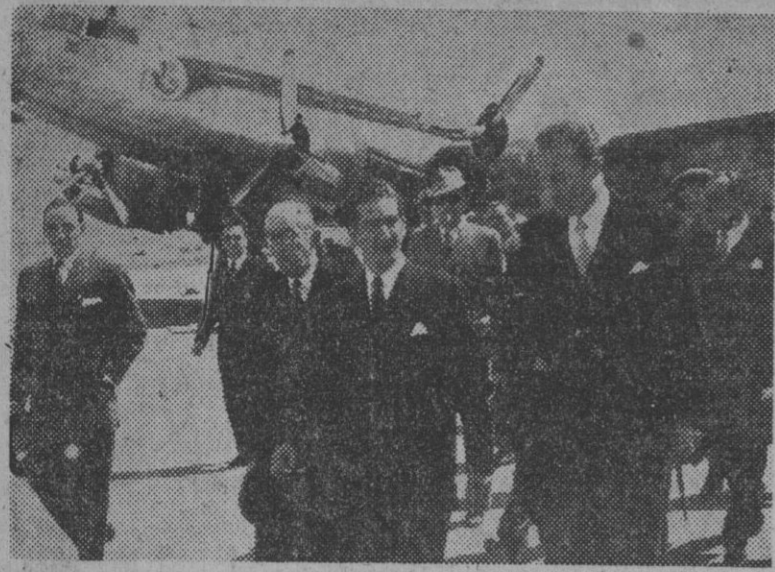
Procedente de París ha llegado al aeropuerto madrileño de Barajas el rey Pedro de Yugoslavia. He aquí el momento de descender del aparato.