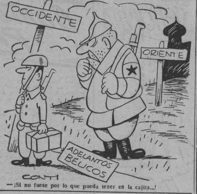
—¡Si no fuese por lo que pueda tener en la cajita...!