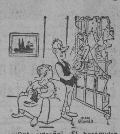
¡Qué extraño! ¡El barómetro marca lluvia y, sin embargo, no se ha mojado! (De 'La Presse', París)