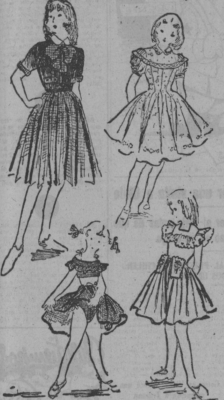
MODELOS INFANTILES PARA PRIMAVERA Y VERANO