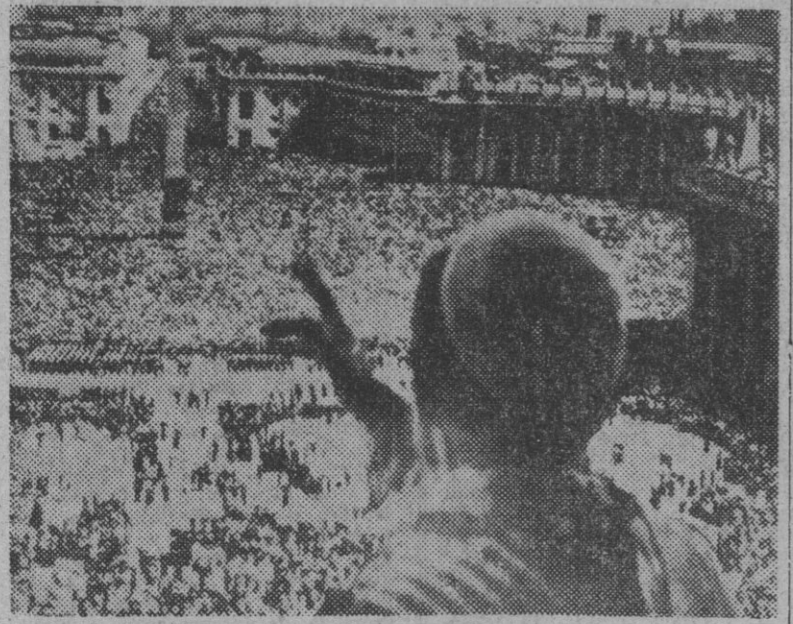
Su Santidad el Papa, Pío XII, da su bendición a 500.000 fieles que se congregaron en la Plaza de San Pedro, de la Ciudad del Vaticano, en la mañana del Domingo de Pascua de Resurrección. Entre ellos figuraban varios millares de peregrinos, procedentes de los países más diversos.

El Domingo de Pascua de Resurrección, en Roma