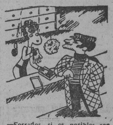
¡Forrados, si es posible; son para robar en una casa sin calefacción. (De 'Estampa', Buenos Aires)