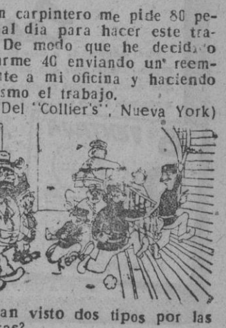
¡Han visto dos tipos por las escaleras? (De 'Vida Mundial', Lisboa)