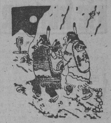
¡Y ya estoy harto de viajar de espaldas a la marcha! (Del 'New Yorker', Nueva York)