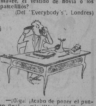
¡Ojalá ¡Acabo de poner el punto final a mis 'Memorias'! (De 'Le Rouge et le Noir', París)