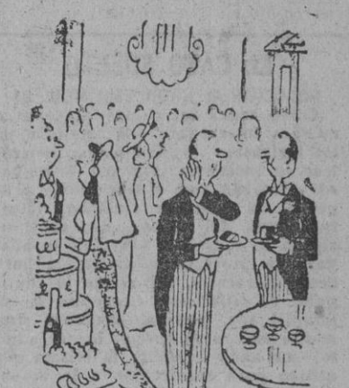
¿Qué es lo que le viene de su madre, el vestido de novia o los pastelillos? (Del 'Everybody's', Londres)