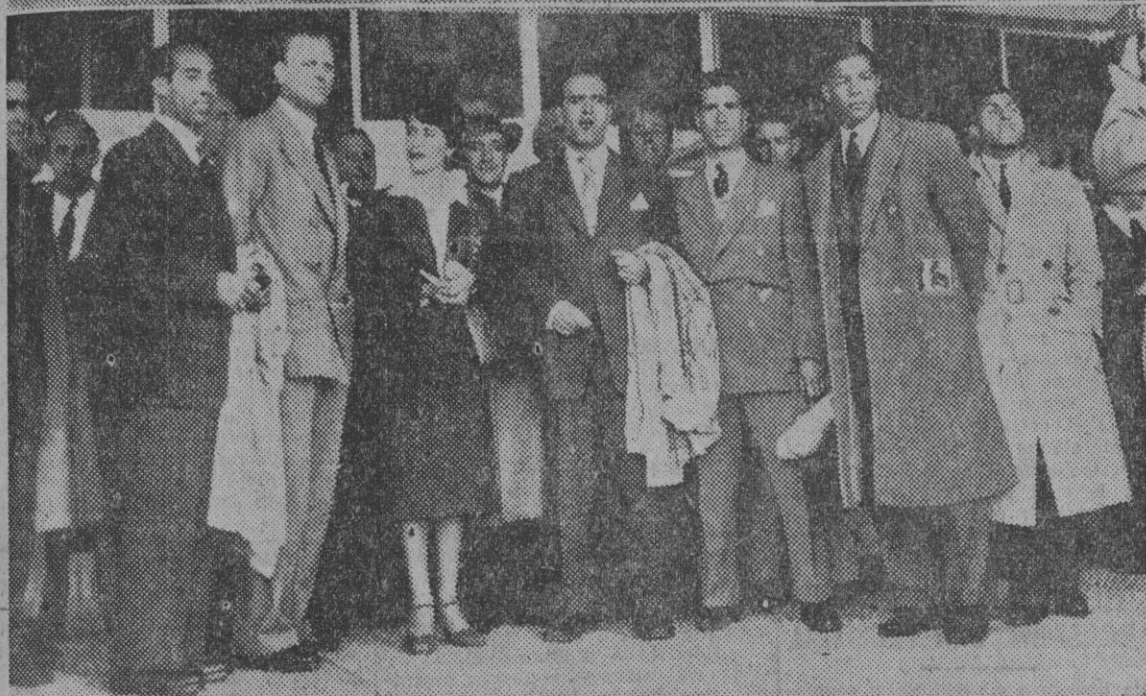
Dos fotografías de los componentes de la selección nacional portuguesa de fútbol, pocos segundos después de su llegada a este aeropuerto, para jugar la eliminatoria del Campeonato del Mundo contra la selección española, el próximo día 2 de abril en el Estadio de Chamartín.