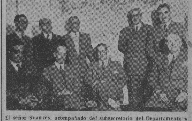
El señor Suanzes, acompañado del subsecretario del Departamento y otras personalidades, rodeado de algunos periodistas que asistieron a la Conferencia de Prensa dada por el señor ministro explicando el desarrollo del Plan de Industrialización de España en el bienio 1950-51.