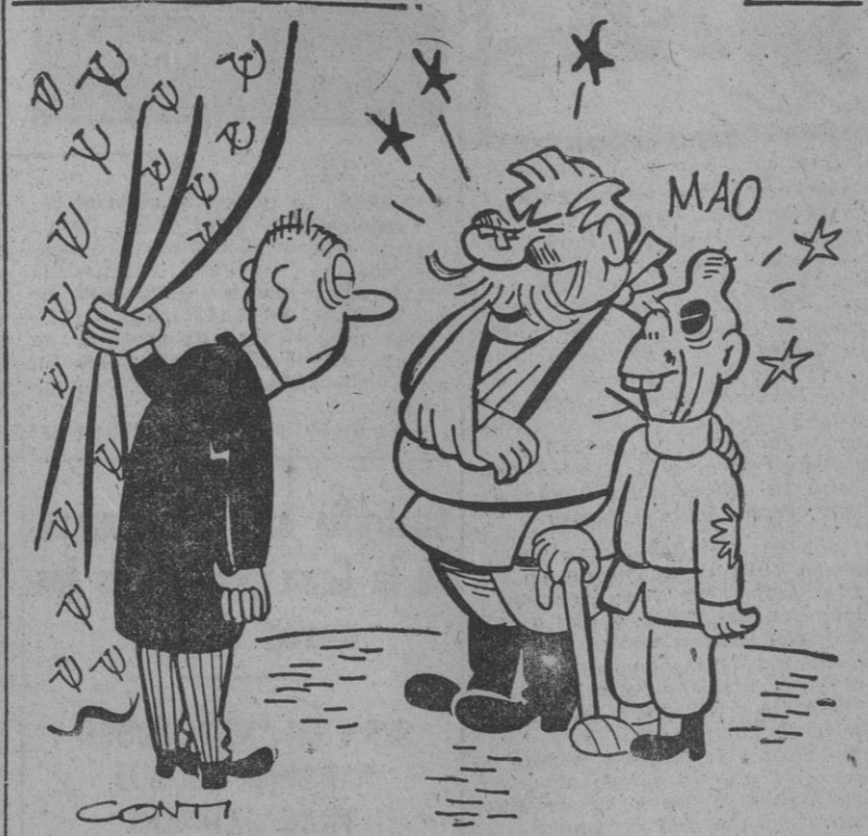
Pueden anunciar a la Prensa que tras unas agradables reuniones hemos firmado un pacto de alianza chino-soviético.

Regresa a Washington la Comisión Investigadora de la zona de Caribe