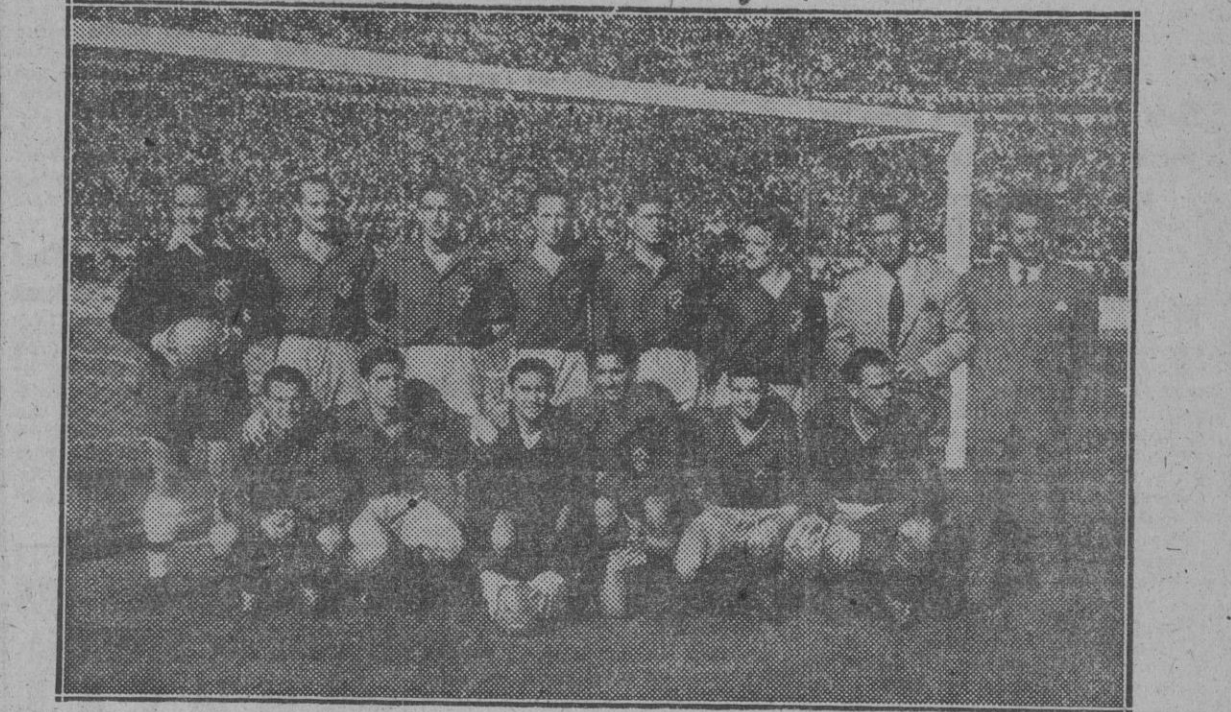
El fútbol español, que comenzó flojamente la temporada, aseguró firmemente su prestigio con sus rotundas victorias frente a Irlanda en Dublín, y contra Francia, en Colombres. Esta es la selección que perdió en Madrid frente a Italia, en marzo de 1949.

Resumen: Cuatro partidos; 1 victoria; 1 empate; 2 derrotas; 5 goles a favor; 8 en contra.