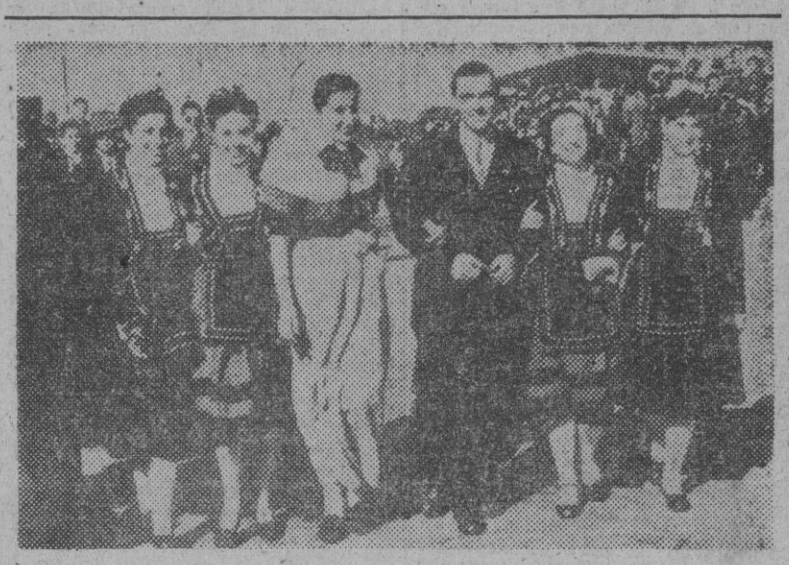
En el Hipódromo de San Felipe, de Lima, se corrió el Gran Premio de "Coros y Danzas de España". En la fotografía aparece un grupo de muchachas de dichos Coros, acogido con simpatía y admiración por los espectadores.