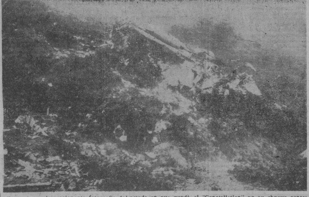
He aquí una impresionante fotografía del estado en que quedó el "Constellation" en su choque contra la montaña y en cuyo accidente perecieron el famoso boxeador Marcel Cerdán y la violinista Ginette Neveu y los demás pasajeros y tripulantes, del avión.