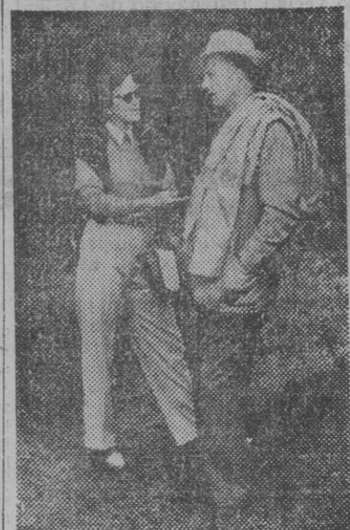
El rey Leopoldo de Bélgica y su esposa, la princesa de Rethy, vistos en Milán, donde asisten a un Concurso Internacional de Golf

Se han agotado las localidades para las primeras funciones