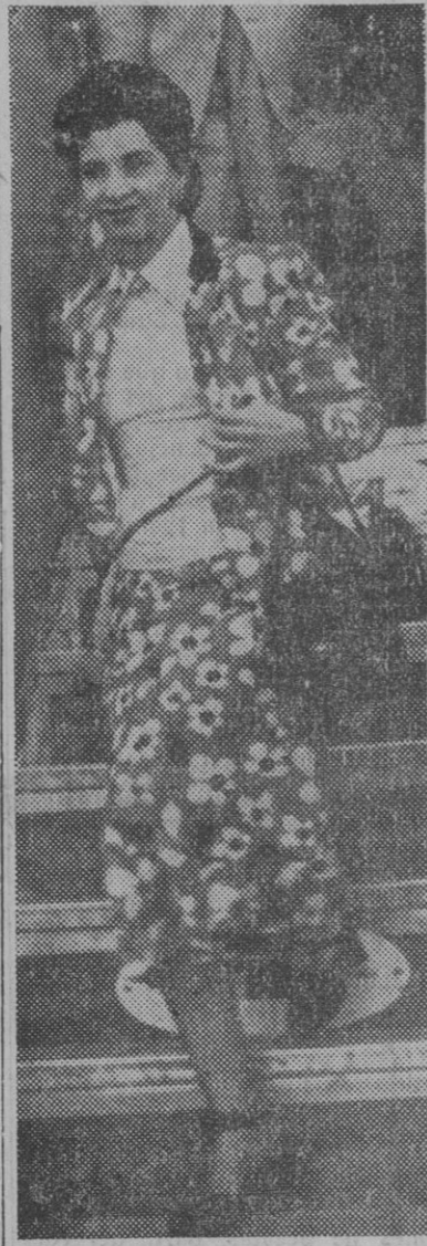
Llegada al aeropuerto de Barajas, procedente de Portugal, de la princesa Shane Pahlavi, hermana del sha de Persia. Después de varios días de permanencia en Madrid, continuará viaje a Andalucía.

Acompañada de la esposa del Mariscal Carmona, la esposa del Caudillo se ha trasladado seguidamente al Palacio de Queluz