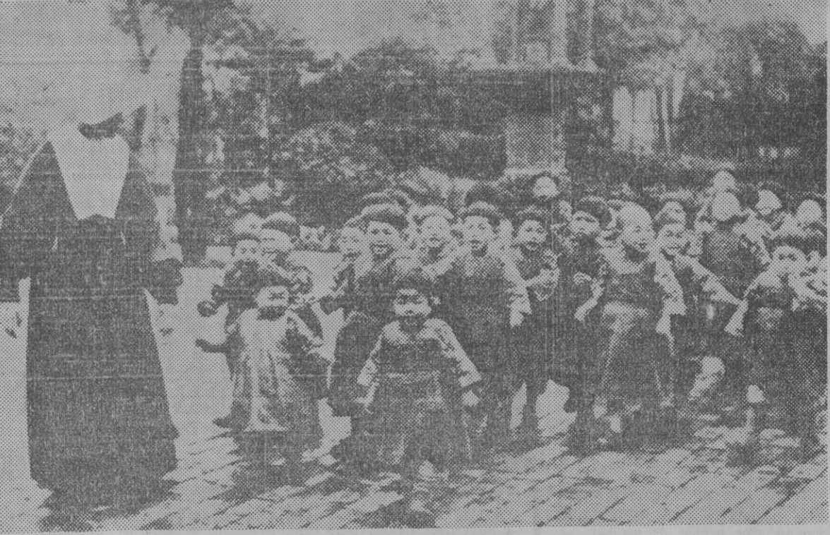
En la China, de la que van apoderándose los comunistas, la labor proselitista de los misioneros católicos es cada día más peligrosa. Ayudémoslos con nuestra simpatía, nuestra admiración, nuestras oraciones y nuestro óbolo.