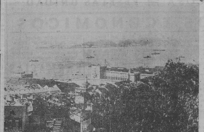
Vista del Tajo a su paso por Lisboa y, en primer término, el Terreiro do Paço, junto al muelle de las Columnas, donde desembarcará el jefe del Estado español a su llegada a Portugal.