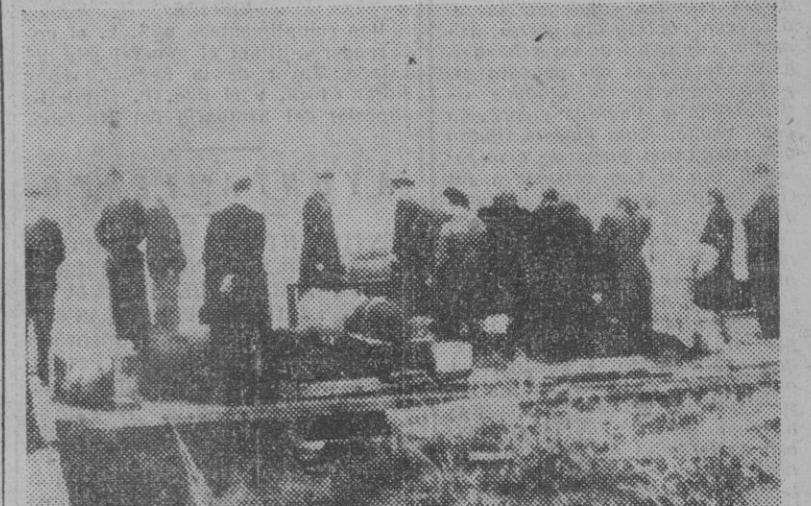
La policía revisa los equipajes y la documentación de catorce alemanes fugitivos de la zona soviética y que han llegado a Suecia por el canal de Falsterbo en una pequeña embarcación.