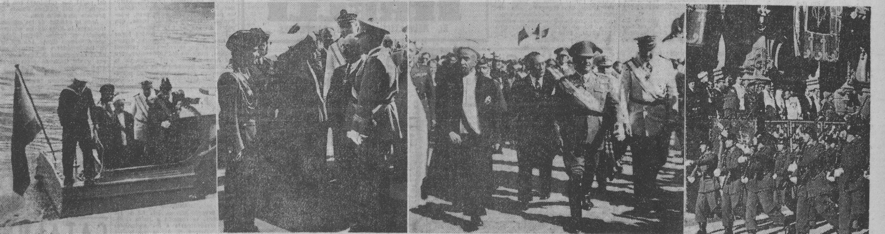
1. El monarca jordano, acompañado del su hijo y del ministro español de Asuntos Exteriores, llega al puerto de La Coruña a bordo de una canoa del "Miguel de Cervantes". — 2. S. E. el Jefe del Estado saluda al rey de Jordania al llegar este al puerto coruñés. — 3. El rey Abdullah y el Generalísimo Franco revisan las fuerzas que rindieron honores. — 4. S. M., acompañado del Caudillo, ministros y personalidades, presencia el brillante desfile militar desde el balcón principal del Ayuntamiento.