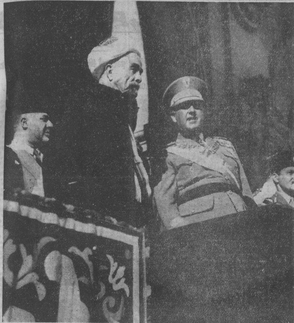
S. M. el rey Abdullah de Jordania, acompañado del Jefe del Estado español, Generalísimo Franco, y de ministros y personalidades de los dos países, presencia, desde un balcón del Ayuntamiento de La Coruña, el desfile militar que se celebró en la capital gallega poco después del desembarco del monarca árabe en aquella ciudad.

A VILA, 7. — Con asistencia de todos los diputados provinciales, ha celebrado sesión extraordinaria la Diputación Provincial, acordando por aclamación ofrecer la primera Medalla de la provincia de Avila a S. E. el Jefe del Estado, interpretando con ello el sentir de los pueblos abulenses. Esta Medalla fue creada en el pasado mes de julio, como condecoración provincial destinada a premiar los excepcionales méritos demostrados en los diversos órdenes culturales y religiosos, literarios y políticos por los hijos de la provincia, así como también los servicios prestados a la misma por aquellas personas que no reúnan la condición de abulenses. Nadie con más méritos que el Caudillo, se ha dicho en la sesión, al que todos los españoles debemos gratitud inmensa. — Cifra.