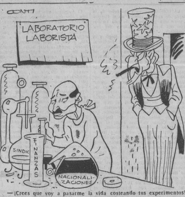
—¡Crees que voy a pasarme la vida costeano tus experimentos!