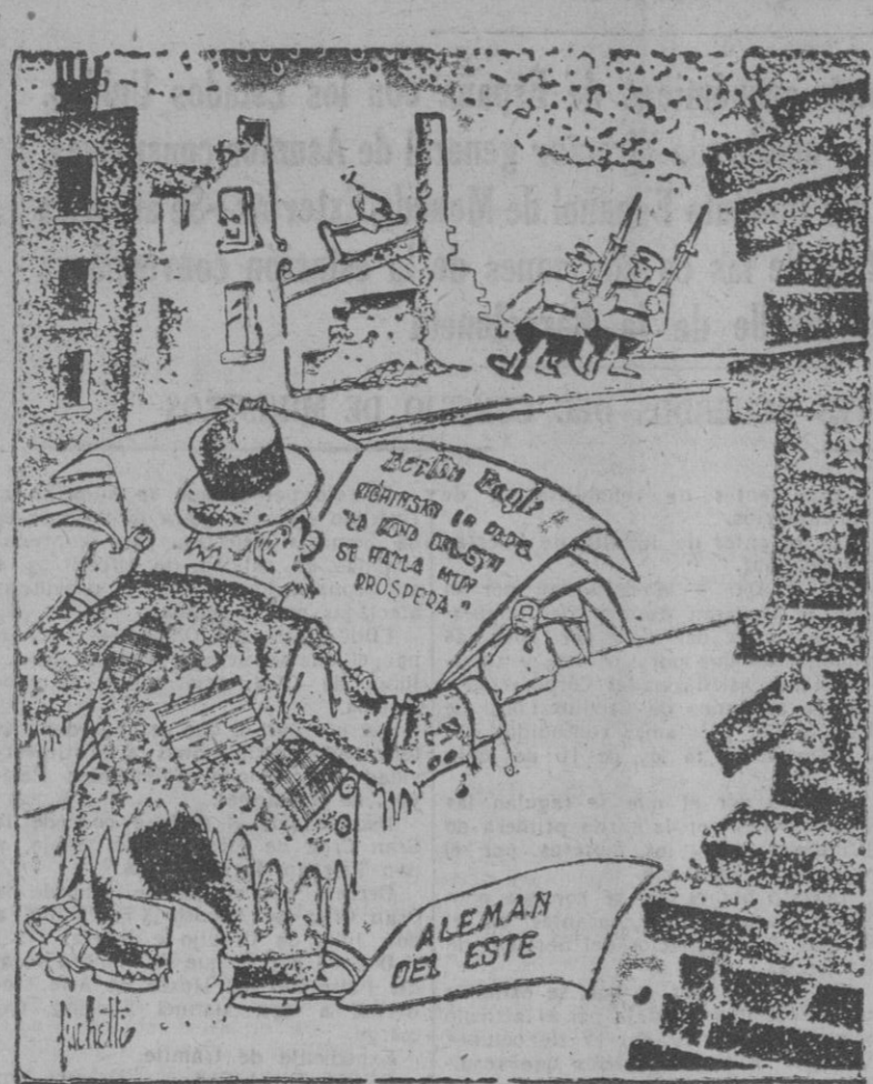
AL LADO DEL TELON DE ACERO

—¡CIEGA, FRENTE! — LLEVA MUY CONVENIENTE QUE VAYAMOS A AYUDARLE, EL NO PODRÁ HACER NADA.