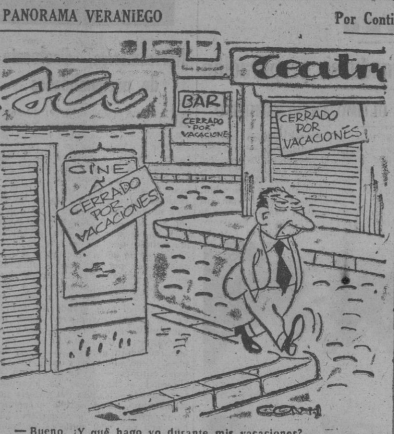
— Bueno, ¿y qué hago yo durante mis vacaciones?..