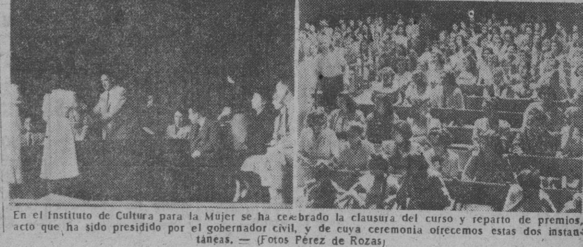
En el Instituto de Cultura para la Mujer se ha celebrado la clausura del curso y reparto de premios, acto que ha sido presidido por el gobernador civil, y de cuya ceremonia ofrecemos estas dos instantáneas.