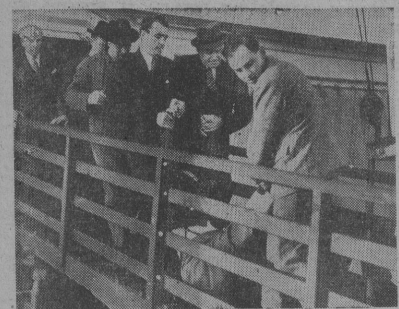
Gerhard Eisler, el comunista alemán escapado de los Estados Unidos en un buque polaco es sacado por la fuerza del barco por la policía británica que le detuvo al llegar a Cowes Road (Inglaterra).