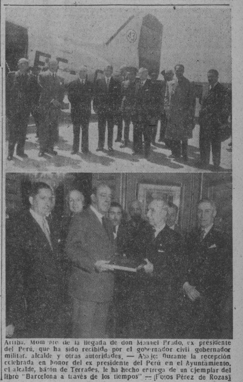
Atiende al momento de la llegada de don Manuel Prado, ex presidente del Perú, que ha sido recibido por el gobernador civil gobernador militar, alcalde y otras autoridades. — A la izquierda: Durante la recepción celebrada en honor del ex presidente del Perú en el Ayuntamiento, el alcalde, don Ferrer, le ha hecho entrega de un ejemplar del libro "Barcelona a través de los tiempos". — (Fotos Pérez de Rozas)