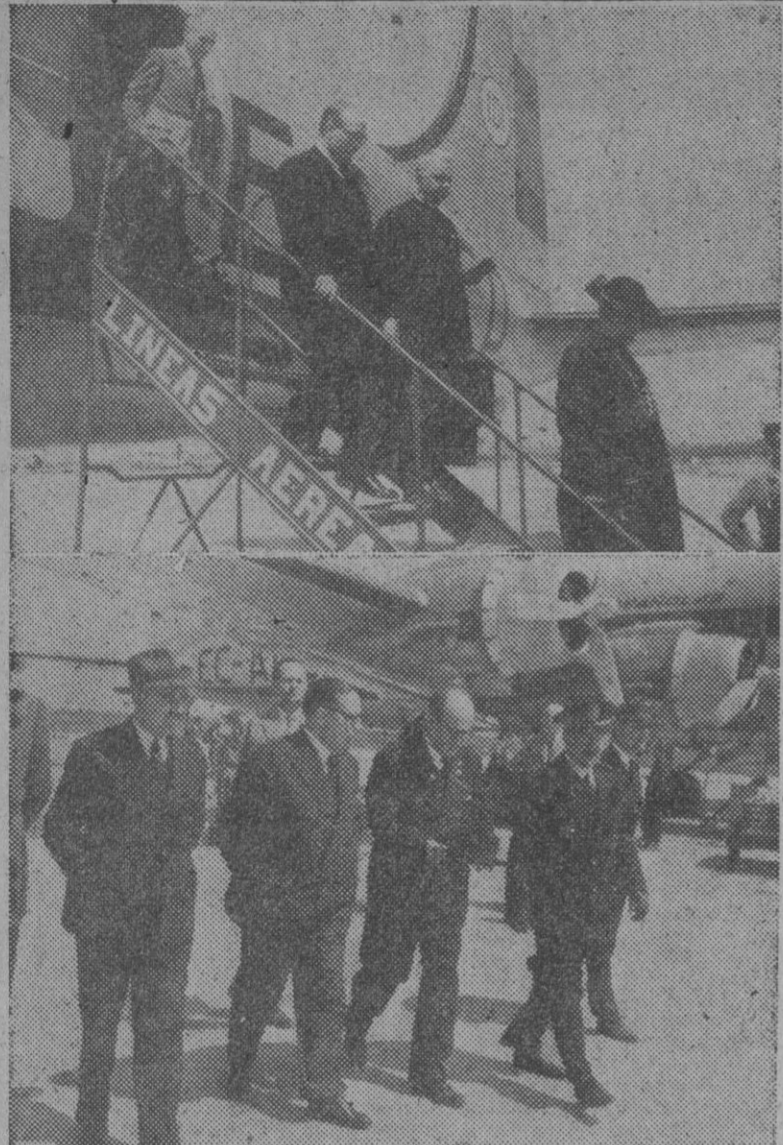
A las 3.20 de esta tarde ha descendido en el aeródromo del Prat, del avión que desde Madrid le conduce a Roma, el ministro de Educación Nacional, señor Ibáñez Martín, donde asistirá a los actos del Centenario de San José de Calasanz en representación del Gobierno español. He aquí el momento de su descenso del avión y conversando con el rector de la Universidad y el gobernador civil accidental y otras autoridades, paseando por el aeródromo, desde donde ha proseguido su viaje a las 4.20.