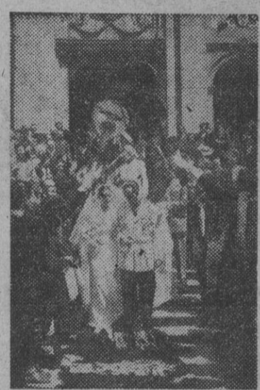
Al celebrarse la boda del fundador de las "tunas", la muchachada estudiantil viste sus clásicas vestimentas, y tomando los instrumentos musicales se asocian bulliciosamente a dicho acontecimiento como homenaje a su fundador

Costa Rica ordena a su delegado en la ONU que vote en favor de España