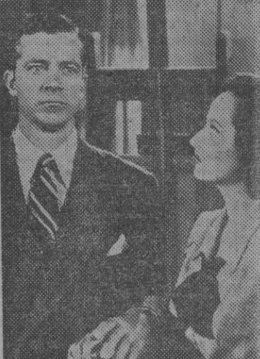
Merle Oberon y Dana Andrews en un interesante primer plano de la película RKO Radio, "Mi corazón te guía", drama romántico en cuyo reparto intervienen, además, Ethel Barrymore y Hoagy Carmichael