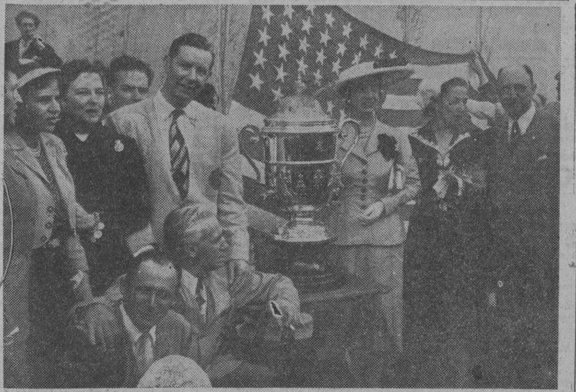
La esposa de S. E. el Jefe del Estado, doña Carmen Polo de Franco, con el tirador norteamericano Clark, que se adjudicó la copa del Campeonato del Mundo de Tiro de Pichón.

Una riada de automóviles y camiones procedentes de las zonas occidentales cruza las líneas de control soviéticas