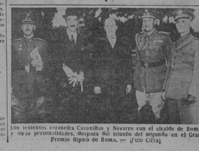
Los tenientes coronales Casanillas y Navarro con el alcalde de Roma y otras personalidades...