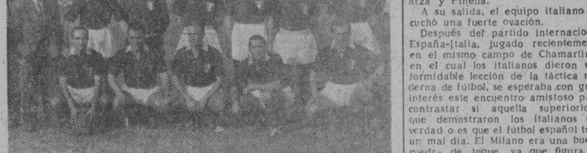
El equipo del Torino, tal como formó en su visita a Barcelona en septiembre de 1947

La primera noticia del accidente informaba que el extremo de un ala del aparato había chocado contra la