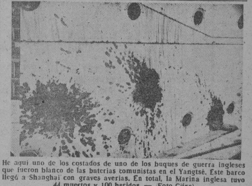
He aquí uno de los costados de uno de los buques de guerra ingleses que fueron blanco de las baterías comunistas en el Yangtsé. Este barco llegó a Shanghai con graves averías. En total, la Marina inglesa tuvo 44 muertos y 100 heridos.