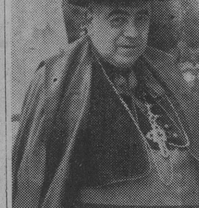
El Dr. don Francisco Cavero Tormo, obispo de Coria, que falleció cuando presidía la procesión de las Palmas en la capital de su diócesis.

WASHINGTON, 12. — Los Estados Unidos reanudarán las relaciones diplomáticas con el actual Gobierno paraguayo, probablemente mañana, miércoles, según se dice en fuentes dignas de crédito.