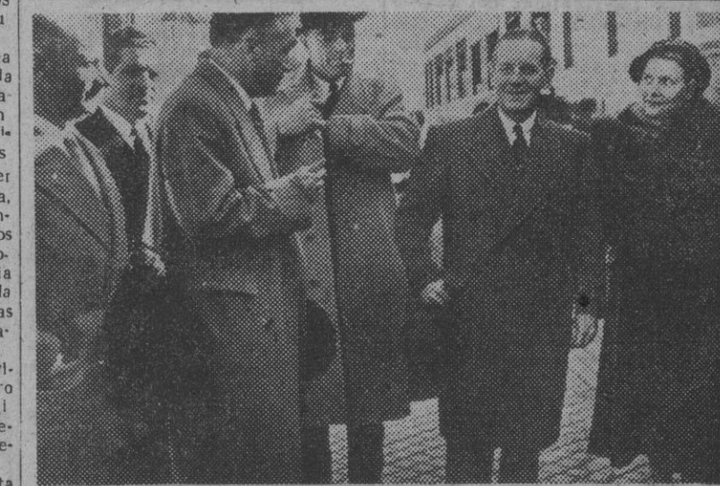
Ha llegado a Irún el magnate de la industria de neumáticos americana, Mr. Harry S. Firestone, hijo, visitará las instalaciones de la marca de su nombre en Bilbao, Madrid y Barcelona...