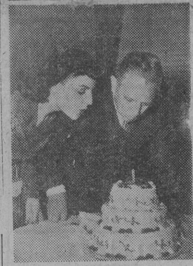
Para celebrar el primer aniversario del "plan Marshall", su administrador general, Paul Hoffman, ha consumido con sus familiares una hermosa tarta en cuya parte superior colocó una vela.