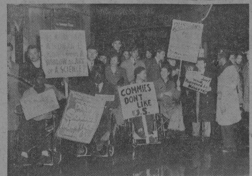
Mutilados de guerra norteamericanos, con pancartas, ante la puerta del Hotel Waldorf-Astoria para protestar por la celebración en dicho hotel de la Conferencia Internacional Cultural y Científica pro Pecho del Mundo, a la que asisten dos mil delegados.

Contra la Conferencia comunista de Nueva York