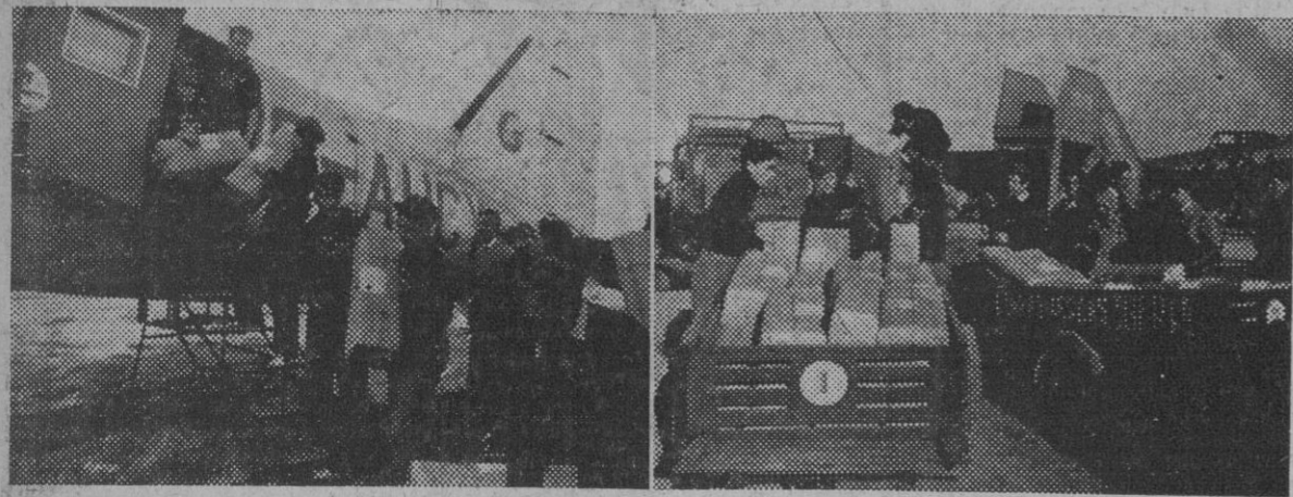
Con destino a Irlanda, un avión inglés ha venido a recoger numerosos fardos de seda manufacturada en España. Momento de cargar los fardos en el avión y las carretillas del aeropuerto conduciendo los paquetes al lado del aparato.