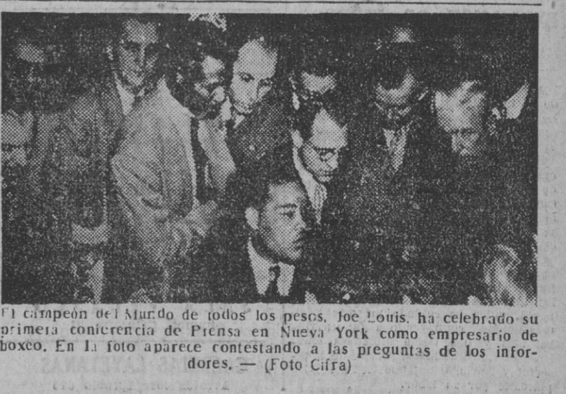
El campeón del Mundo de todos los pesos, Joe Louis, ha celebrado su primera conferencia de Prensa en Nueva York como empresario de boxeo. En la foto aparece contestando a las preguntas de los informadores.