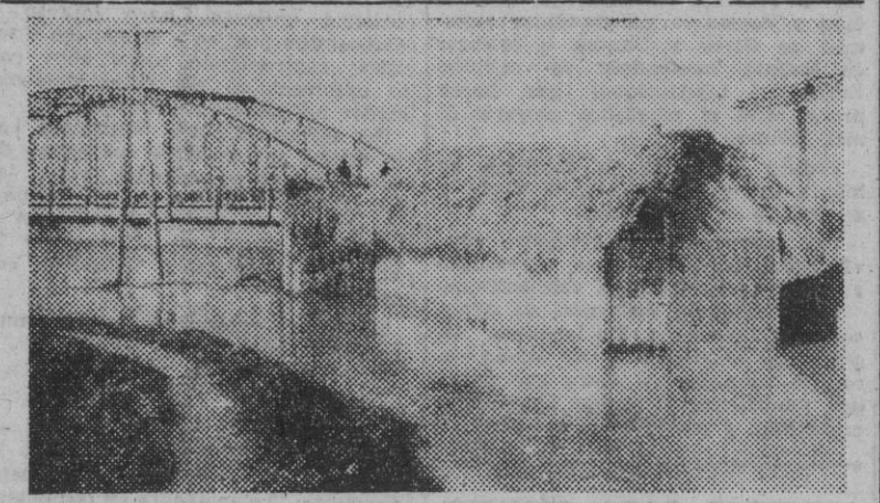
Vista de la altura que han alcanzado las aguas desbordadas del río Jucar. Al fondo, el puente de Riola sobre dicho río.