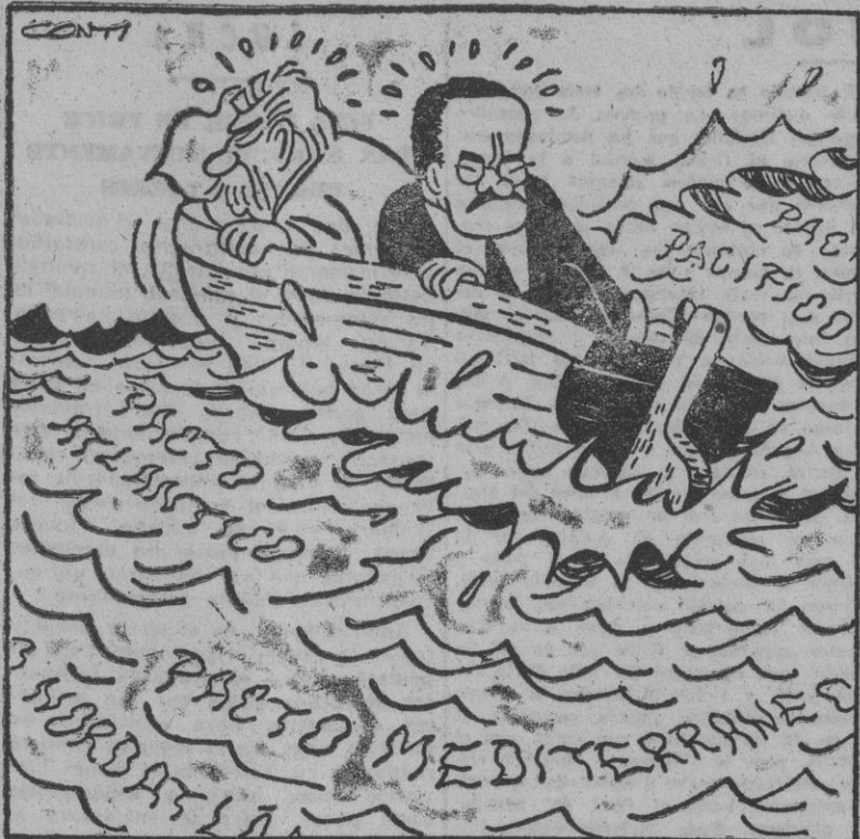
— ¡Me está mareando tanto movimiento!

Inglaterra proyecta la constitución de los EE. UU. de África