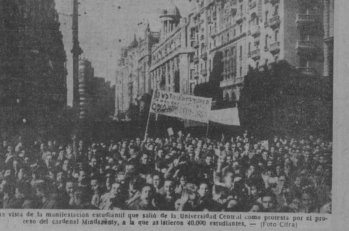
Una vista de la manifestación estudiantil que salió de la Universidad Central como protesta por el proceso del cardenal Mindszenty, a la que asistieron 40.000 estudiantes.