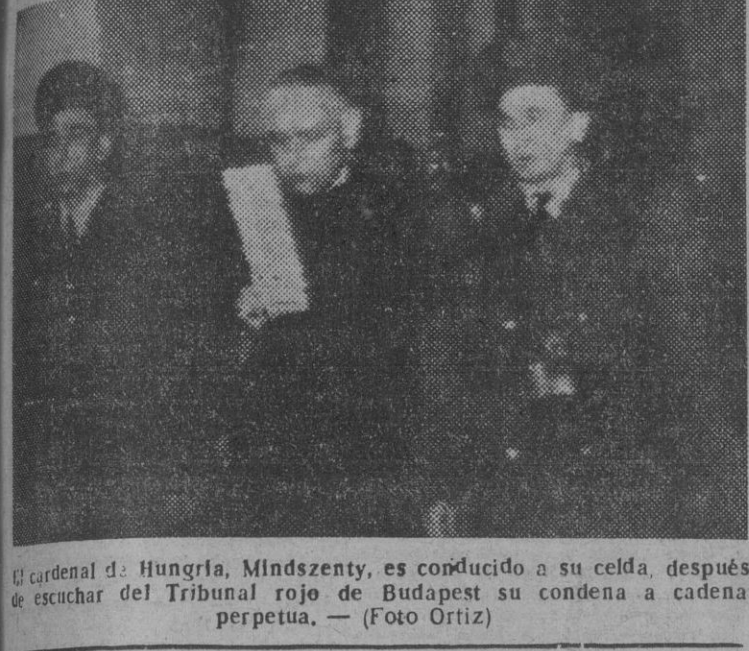
El cardenal de Hungría, Mindszenty, es conducido a su celda, después de escuchar del Tribunal rojo de Budapest su condena a cadena perpetua.