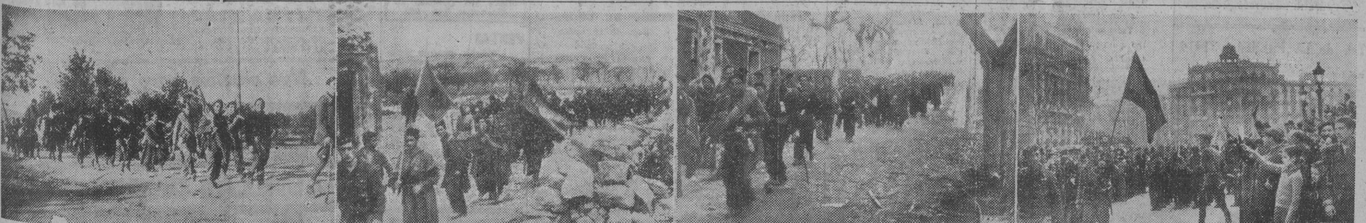
La victoriosa ofensiva contra las fuerzas rojas que dominaban Cataluña, era esperada con anhelo por todos los catalanes, y, al llegar los heroicos soldados nacionales a la Plaza de Cataluña, todo el pueblo barcelonés, con entusiasmo inenarrable, ovacionó interminablemente a las fuerzas, llorando de emoción al ver terminados, por fin, gracias a ellas, sus dolores y padecimientos.