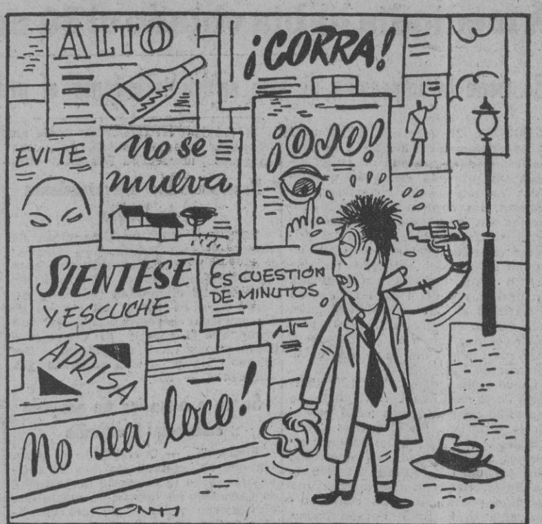
La tragedia del hombre que leía todos los anuncios.