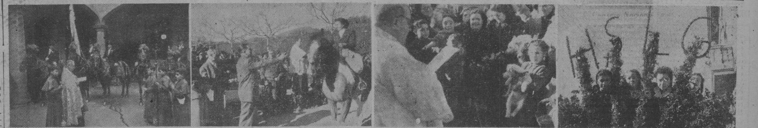
1. Bendición de los típicos «Tres Tombs» en la Casa Provincial de Caridad. — 2. El gobernador civil, Dr. Baeza Alegria, hace entrega de los pancillos benditos a los concurrentes a la bendición en el Polo Jockey Club. — 3. La bendición de animales cañeros en la iglesia de los PP, Escolapios de San Antonio. — 4. Las señoritas que iban en una de las carrozas de la Hermandad de Labradores y Ganaderos del Prat de Llobregat. — (Fotos Pérez de Rozas)