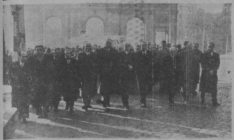
El ministro de Educación Nacional, señor Ibáñez Martín; directores generales de Enseñanza Primaria, Seguridad y Prensa, y otras personalidades en la presidencia del duelo en el traslado de los restos mortales del fallecido maestro Turina.

Están acusados de haber intentado derrocar al Gobierno por la fuerza Sepelio del maestro Turina en Madrid