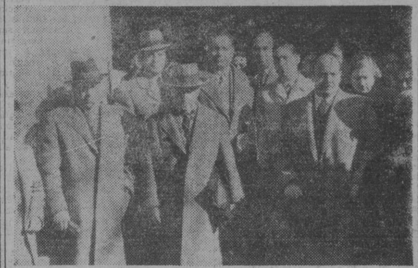
La Junta directiva y algunos afiliados de la Cooperativa de Transportes, Tracción de Sangre, a la salida del solemne Oficio celebrado esta mañana en los EE. PP. de la Ronda de San Pablo, con motivo de la fiesta de su Patrón, San Antonio Abad

La Cooperativa de Transportes, Tracción de Sangre, cuya Directiva es elegida por los mismos socios, dentro del seno de la Sociedad, fue fundada en el año 1941 y cuenta en la actualidad con 1.400 afiliados, cesando 4.600 caballos y más de 6.000 vehículos para diversos servicios dedicados al transporte urbano de mercancías.