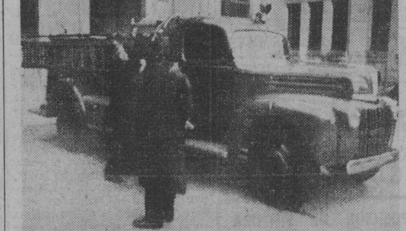
El nuevo coche extintor de incendios para los bomberos de Barcelona, cuyas pruebas se verificaron ayer a última hora de la tarde