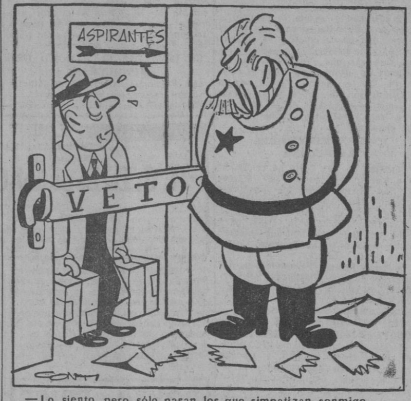
—Lo siento, pero sólo pasan los que simpatizan conmigo.