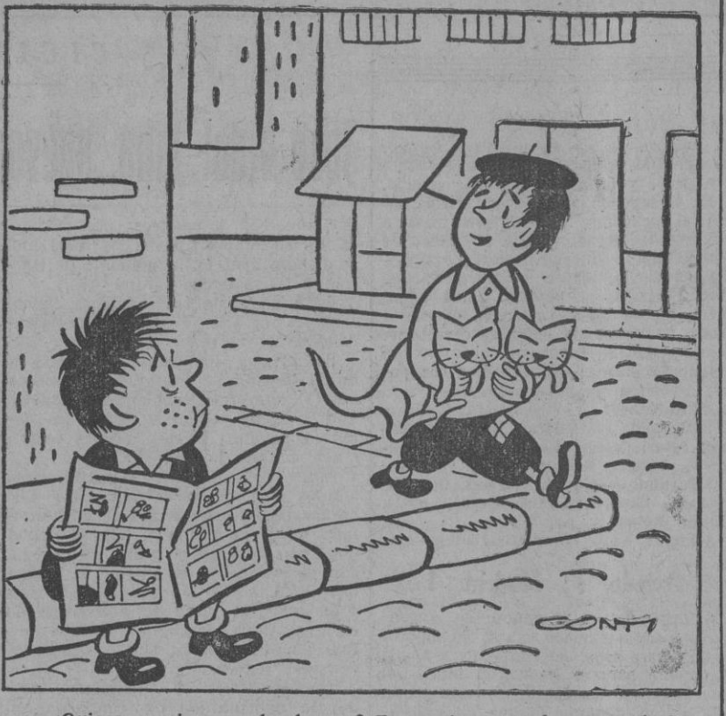
—¿Quieres venir a ver los leones? Tengo dos entradas para el circo.