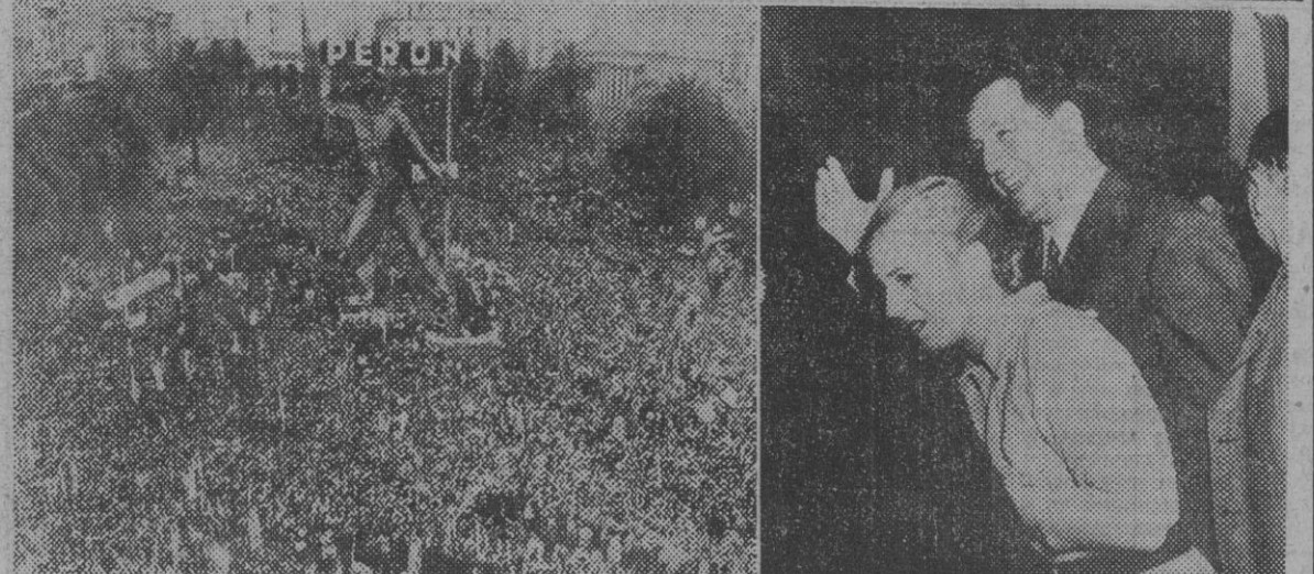
Más de medio millón de personas se congregaron en Buenos Aires frente al palacio presidencial para acclamationar al presidente Perón con ocasión del III aniversario de su breve exilio y su aparición como contendiente para la Presidencia del país. En la foto vemos al presidente y su esposa, recibiendo desde un balcón del palacio la manifestación de adhesión de su pueblo.