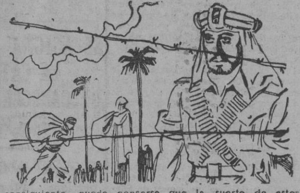
consiguiente, puede pensarse que la suerte de estos pobres seres sin patria y sin hogar no se decida hasta que haya terminado el conflicto entre árabes y judíos, que absorbe junto a otros no menos graves, la atención del Mundo.

El hecho de que haya sido constituido un alto Comité para los refugiados, en El Cairo, con la colaboración de la Cruz Roja y de la Media Luna Roja no viene a dar una solución definitiva al enorme problema de las poblaciones desplazadas. De hecho, es un problema de orden político, y no puede llegarse a una solución radical del mismo más que por un acuerdo directo entre judíos y árabes. A este respecto, se ha declarado en Telaviv que Israel no puede aceptar la repatriación de los refugiados antes de la firma de la paz. Por motivos parecidos, Inglaterra se negó a acoger, durante la guerra, a los fugitivos de los países ocupados por el Eje. No es de extrañar, pues, que Israel se sirva de este precedente para defender sus intereses en Palestina. Por