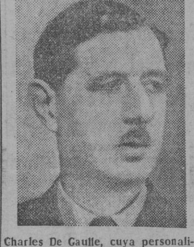
Charles De Gaulle, cuya personalidad se proyecta como un enigma en el ambiente electoral

El 17 de octubre  ltimo, los concejales de 37.983 Ayuntamientos de Francia procedieron a la designaci n de los delegados, que, el 7 de este mes elegir n a los 246 Consejeros de la Republica. En los municipios de