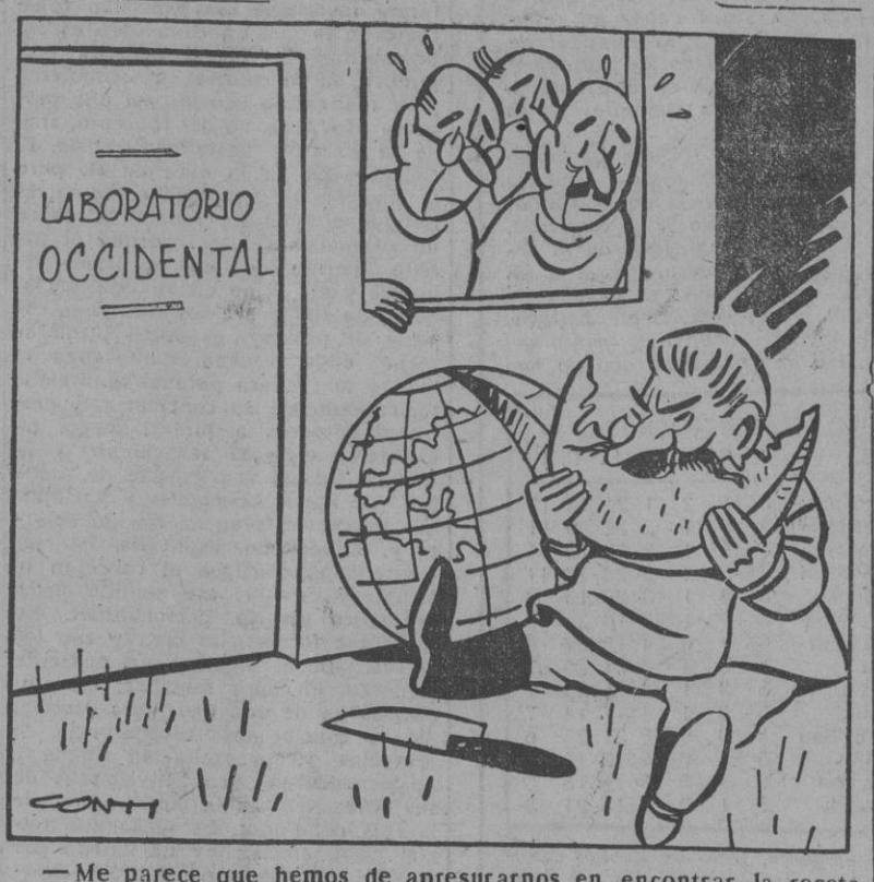
— Me parece que hemos de apresurarnos en encontrar la receta para quitarle el apetito.