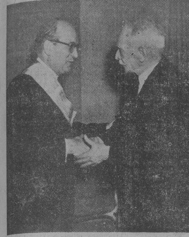
1. El señor Ibáñez Martín agradece la condecoración con que fué galardonado por el presidente Carmona antes de su salida para España. 2. El ministro español de Educación Popular, a su llegada al aeropuerto de Madrid, donde le esperaban el embajador de Portugal, señor Carneiro Pacheco; el subsecretario de Educación Popular y directores generales de su departamento.