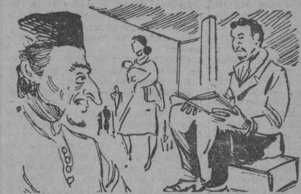
personales. Entre esos seres figuran los refugiados en Palestina, cuya situación ha llegado a poner en grave peligro la política militar de los dos bandos en lucha.

MIENTRAS la Organización de las Naciones Unidas discute los diferentes problemas internacionales planteados en el Mundo, muchos de los seres afectados por estos problemas esperan paciente y pacientemente la resolución de los mismos, y, con ella, la de los propios problemas