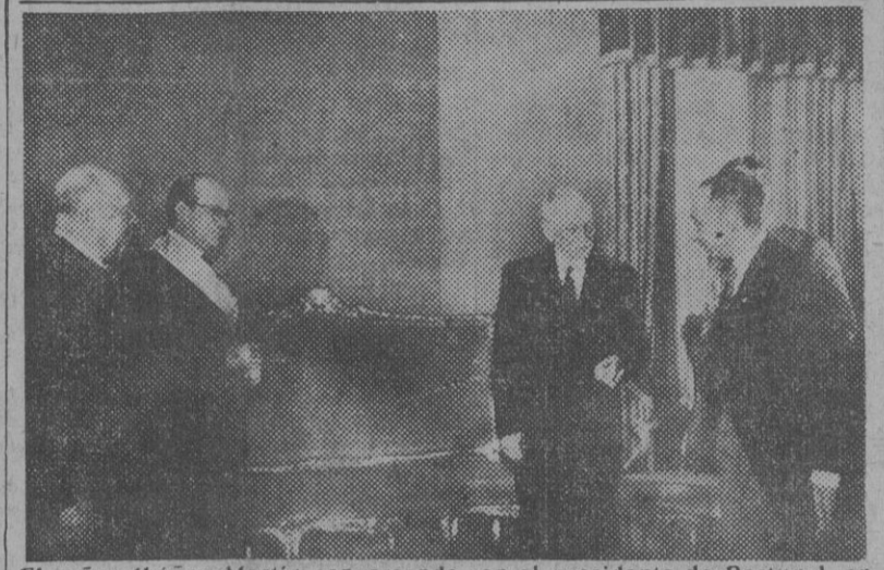
El señor Ibáñez Martín conversando con el presidente de Portugal, en presencia de su colega portugués y del embajador español, después de haber sido condecorado con la Gran Cruz de Instrucción Pública

Del viaje del ministro de Educación Nacional a Portugal