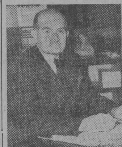
El general sir William Slim, nuevo jefe del Cuartel General Imperial Británico...

El nuevo jefe del Cuartel Imperial Británico