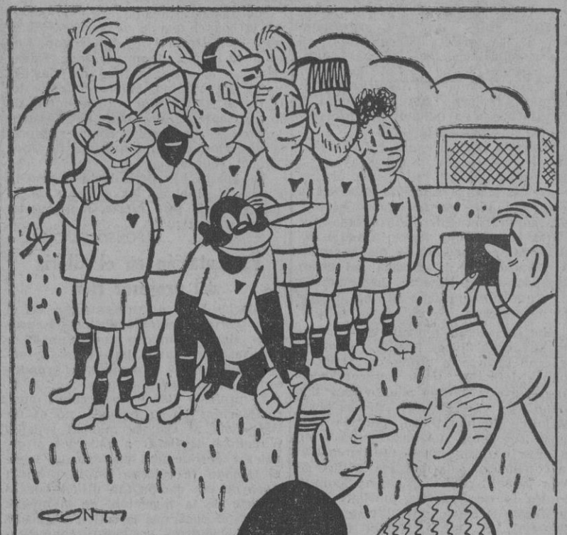
— Si, al fin hemos logrado formar un equipo que será el orgullo de la localidad.