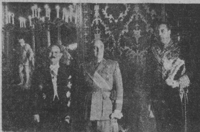
1. El Caudillo, con el ministro de Asuntos Exteriores, y don Eliag Brache, nuevo embajador de la República Dominicana en Madrid, en el acto de presentación de credenciales celebrado ayer en el Palacio de Oriente. — 2. Acompañado por la guardia mora, don Eliag Brache sale de Palacio después de la ceremonia.