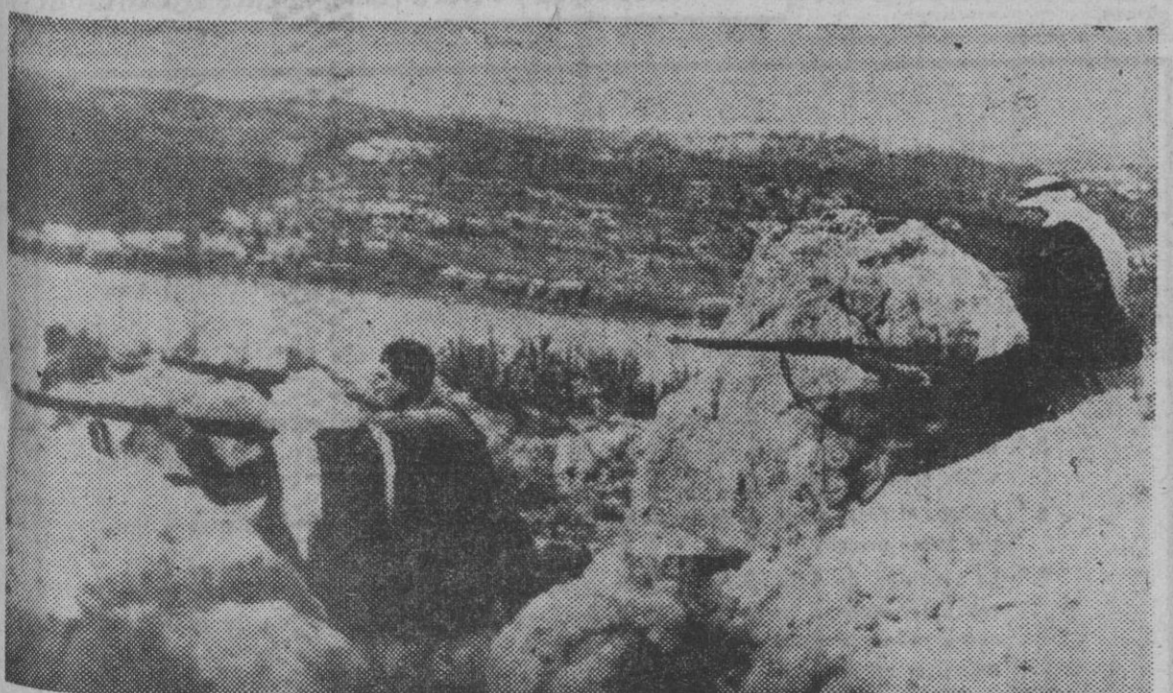
He aquí una típica estampa de la guerra en Palestina, cuya orfiza situación se ve agravada cada día por nuevas complicaciones. La foto muestra a una patrulla árabe parapetada en las montañas que dominan un importante cruce de carreteras.