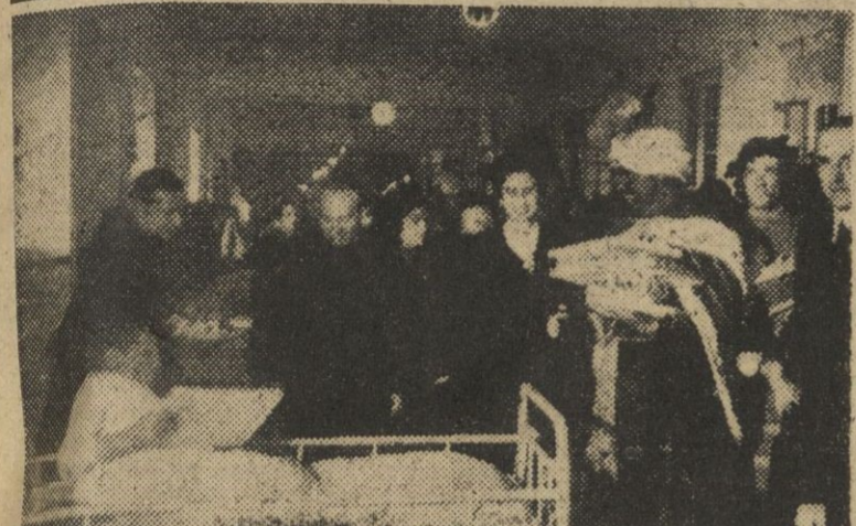
La esposa del Caudillo, con los Reyes Magos de Radio Nacional, reparan juguetes a los enfermos del Hospital de San Rafael, de Madrid

Los Reyes Magos en el Hospital de San Rafael