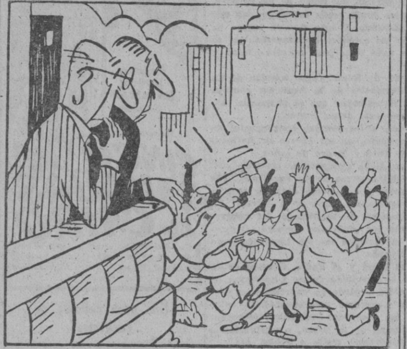
Se están pegando porque no quieren que se acepte el préstamo del plan Marshall y ahora lo necesitaremos aunque sólo sea para comprar arroz.