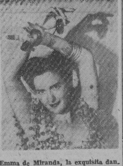
FIGURA DE LA DANZA

Emma de Miranda, la exquisita danzarina española, que el próximo domingo, a las once de la mañana, dará un interesante recital de sus notables creaciones en el teatro Calderón