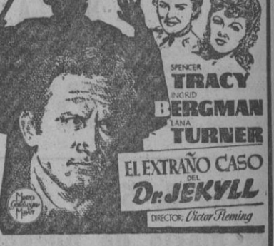
Tres grandes estrellas en un «film» sorprendente, emocionante y excepcional...