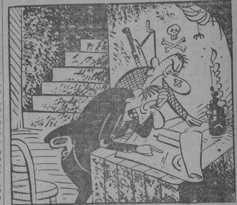
— Si esto que has conseguido son los planos de los nuevos aviones de reacción, pero me extraña que aquí diga: “Modelo especial de España”.