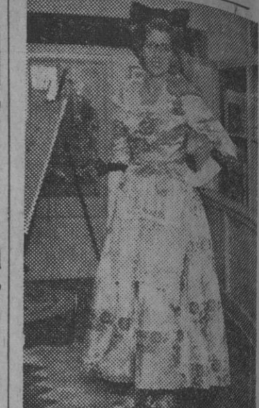
Mod lo que será entregado a doña María Eva Duarte de Perón, regalo de la Sección Feminina de F. E. T. de Barcelona

Obsequio a doña María Eva Duarte de Perón