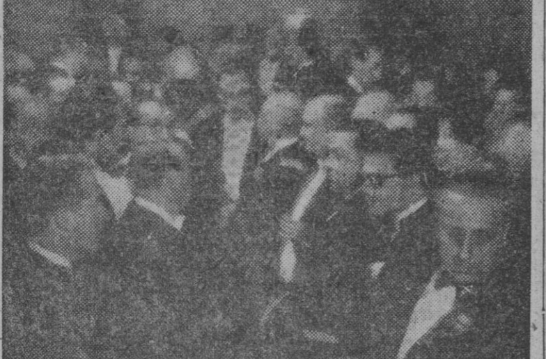
Varios momentos de la cena de gala ofrecida anoche por la Diputación a Su Excelencia el Jefe del Estado, a la que asistieron su esposa y las autoridades barcelonesas.