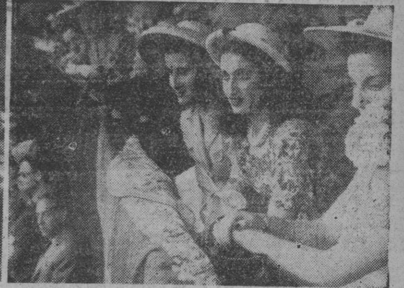
1. Con delirante entusiasmo, el público acoge la presencia del Caudillo, en la plaza de toros en la corrida celebrada ayer en su honor. — 2. La presidencia en la plaza. — 3. La señorita Carmen Polo presenciando la corrida.