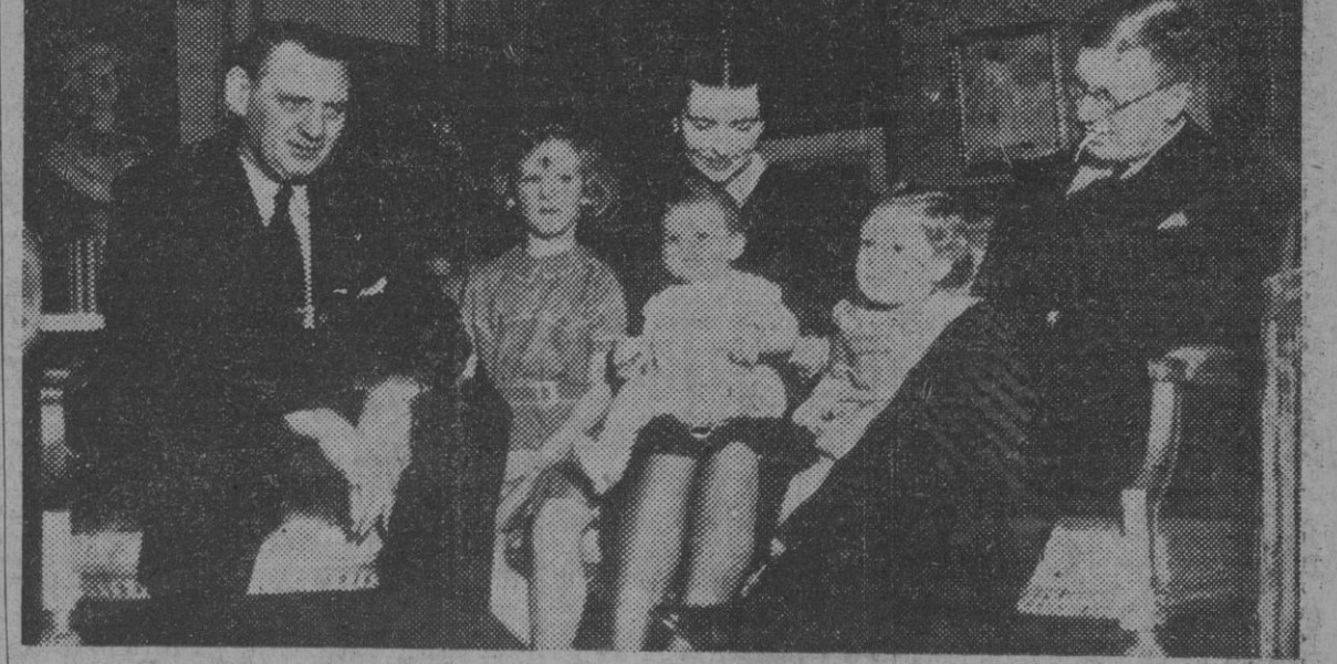
Los príncipes Federico e Ingrid, herederos de la corona de Dinamarca, con sus tres hijos, y el príncipe Gustavo Adolfo, heredero del trono de Suecia, durante la visita que hicieron los primeros al último en Estocolmo.