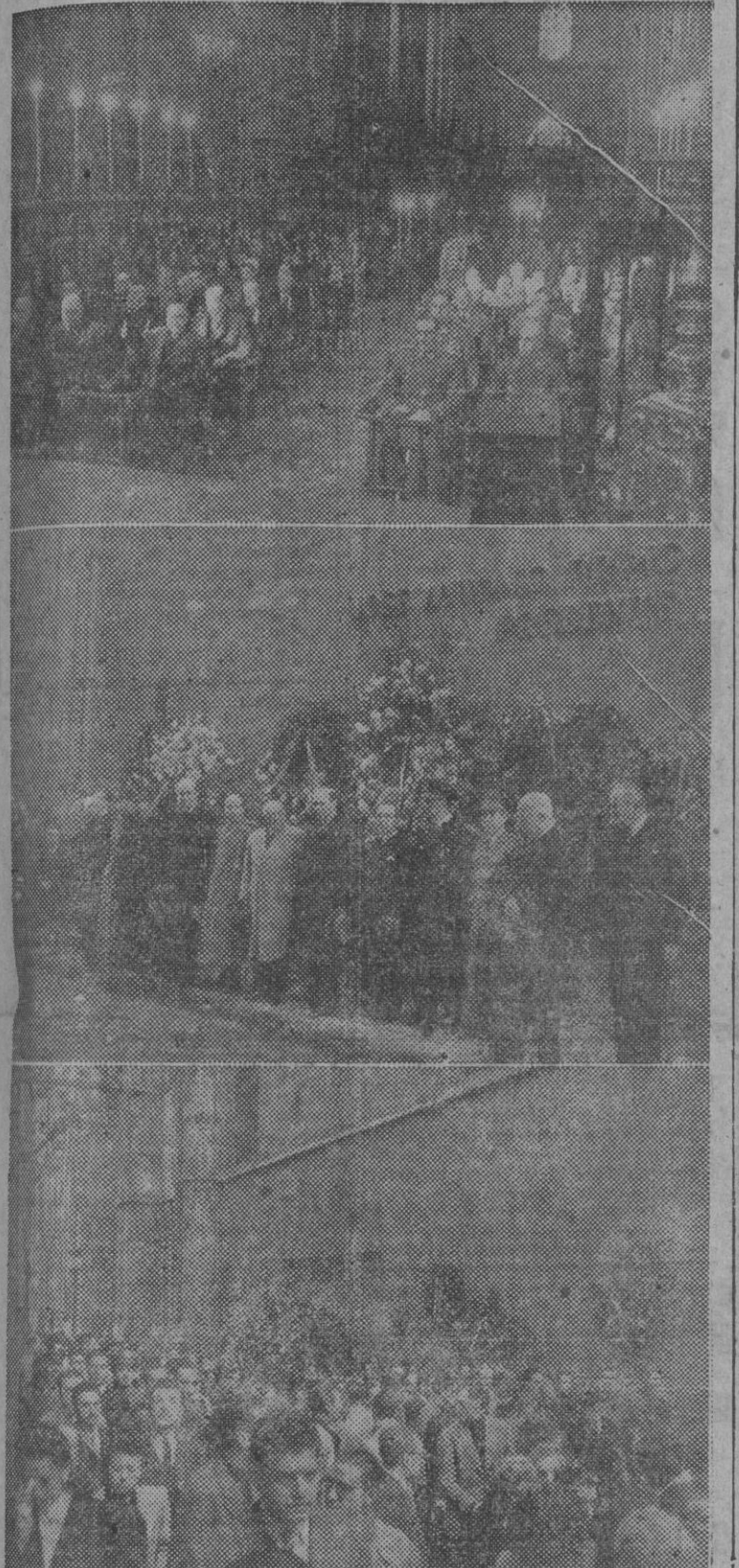
Esta mañana se han celebrado solemnes actos conmemorativos de la muerte de José Antonio. En la información gráfica, un aspecto de la Catedral durante el oficio fúnebre, las autoridades después de la colocación de las coronas ofrecidas a la memoria del fundador de la Falange, y la salida de los fieles de los pios sufragios en la Basílica.