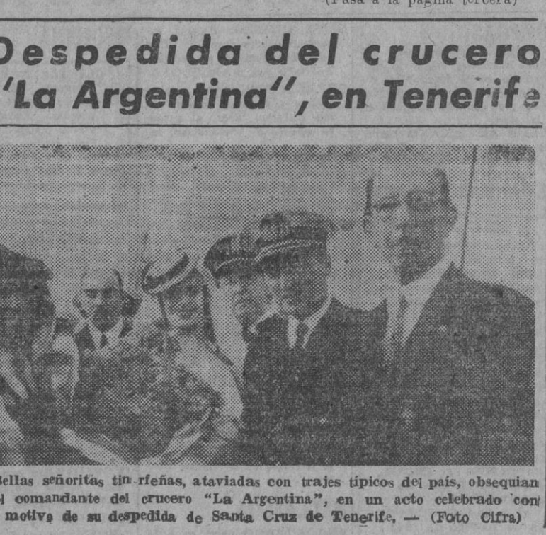
Bellas señoritas tinerfeñas, ataviadas con trajes típicos del país, obsequian al comandante del crucero "La Argentina", en un acto celebrado con motivo de su despedida de Santa Cruz de Tenerife.