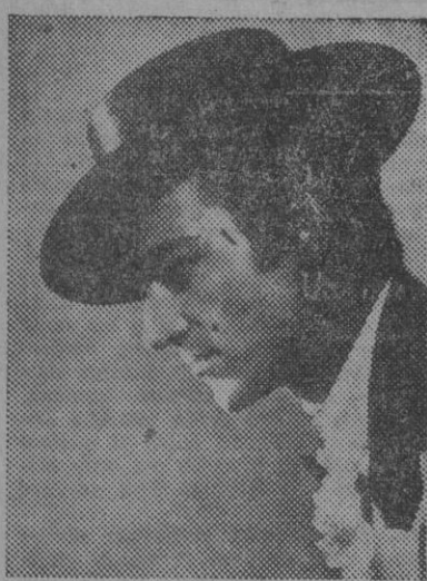
José Greco, principal figura del "Ballet español", de Pilar López, que tan excepcional acogida obtiene en el teatro Calderón