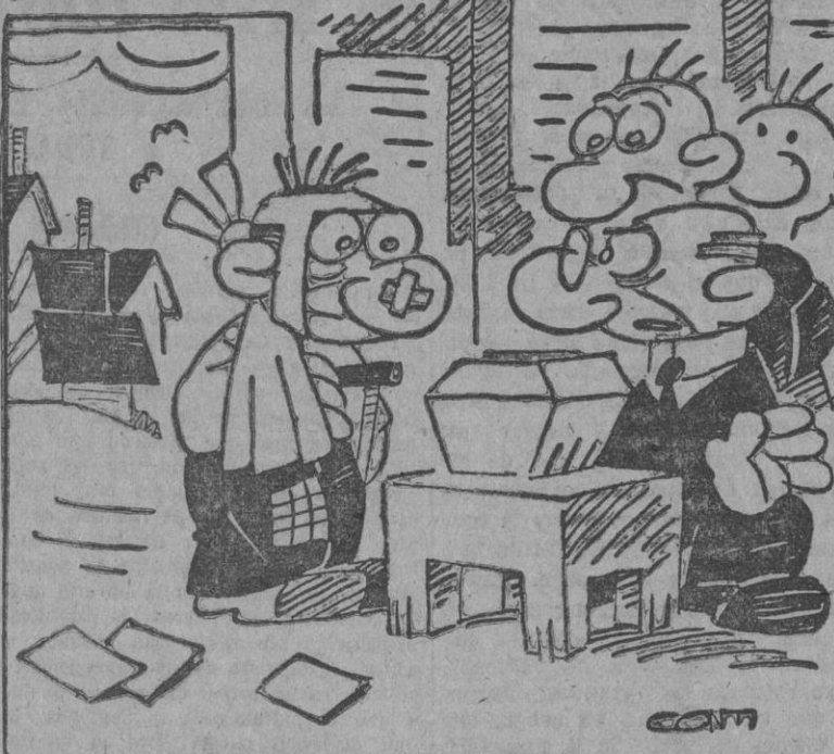
— ¡Es usted el único habitante del pueblo que ha venido a votar! — Es que los otros aún no han sido dados de alta.