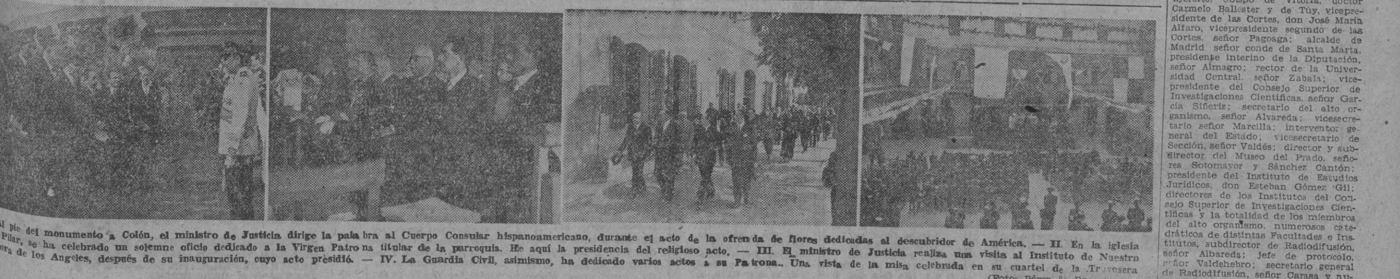
I. Al pie del monumento a Colón, el ministro de Justicia dirige la palabra al Cuerpo Consular hispanoamericano, durante el acto de la ofrenda de flores dedicadas al descubridor de América. — II. En la iglesia del Pilar, se ha celebrado un solemne oficio dedicado a la Virgen Patrona de los Aragoneses, después de su inauguración, cuyo acto presidió. — III. El ministro de Justicia realiza una visita al Instituto de Nuestra Señora de los Angeles, después de su inauguración, cuyo acto presidió. — IV. La Guardia Civil, asimismo, ha dedicado varios actos a su Patrona. Una vista de la misa celebrada en su cuartel de la Traversera