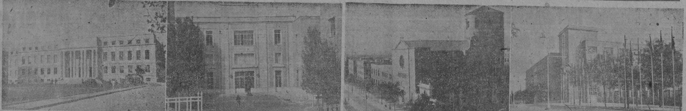
Las numerosas actividades del Consejo de Investigaciones Cientificas se traducen en la creación de nuevos edificios e instituciones. He aquí algunas de ellas, inauguradas en la mañana de hoy por S. E. el Jefe del Estado, I. Edificio central del Consejo o pabellón de Gobierno, donde se celebrará el solemne acto inaugural de los nuevos inmuebles. — II. Fachada principal del Instituto Ramiro de Maeztu. — III. La capilla del bloque de nuevas construcciones. — IV. Vista, parcial del Instituto Torres Quevedo.