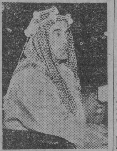
El emir Abdullah Ibn Hussain, proclamado rey de Transjordania