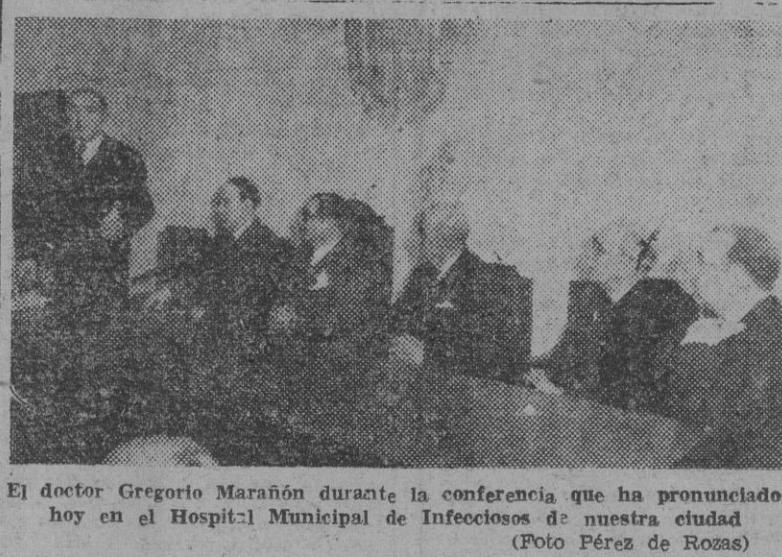
El doctor Gregorio Marañón durante la conferencia que ha pronunciado hoy en el Hospital Municipal de Infecciosos de nuestra ciudad

EL DOCTOR GREGORIO MARAÑÓN, EN BARCELONA