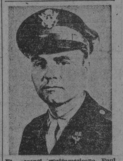
El coronel norteamericano Paul W. Tibbets, que pilotó la "super-fortaleza" que lanzó la primera bomba atómica de la Historia.