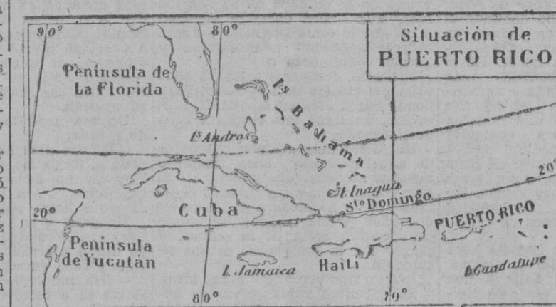
Situación de la isla antillana de Puerto Rico, a la que Norteamérica va a conceder la calidad de Estado de la Unión, con igualdad de derechos a los de la metrópoli