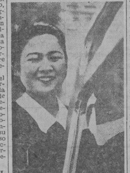
Princesas de los Primeros Tiempos. En los anales Wei, redactados por Cheng Shu, se encuentra la historia de la "Reina Wa, amiga de Wei"...