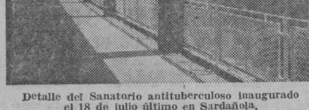
Detalle del Sanatorio antituberculoso inaugurado el 18 de julio último en Sardañola.