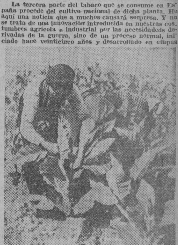
La tercera parte del tabaco que se consume en España procede del cultivo nacional de dicha planta. Ho aquí una noticia que a muchos causará sorpresa...

Excelentes resultados técnicos en la aclimatación de las más variadas especies