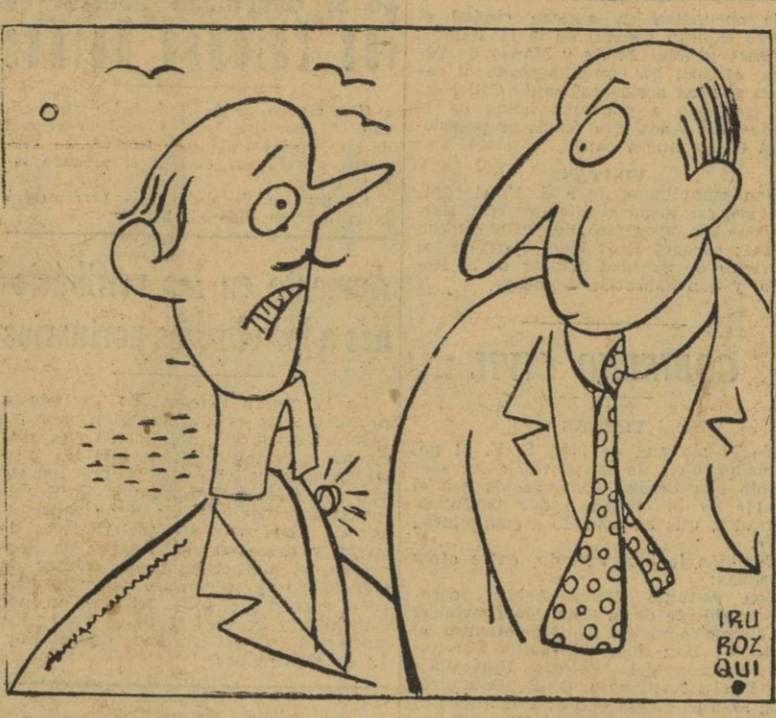
— Si usted cree que Rusia es una democracia, yo soy la Greta Garbo...